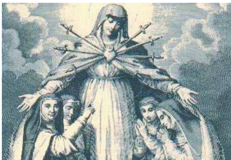
La Vergine Addolorata e le Adoratrici ai suoi piedi

I locali erano però ristretti e solo il 27 aprile 1951 in coincidenza con il Congresso Eucaristico Sardo, la chiesa donata dalla parrocchia ad uso del Monastero venne aperta. Ancora oggi la chiesa e il monastero sono un riferimento per la città.