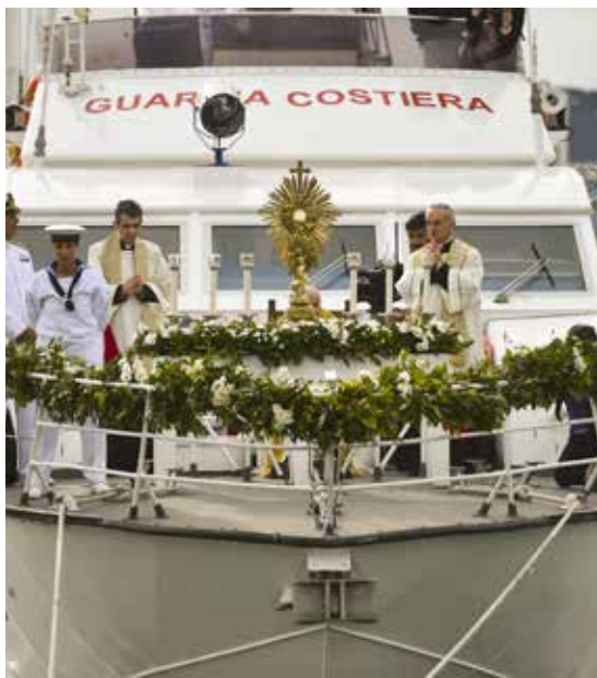
L'arrivo del Santissimo Sacramento sulla motovedetta

Il volto della Misericordia, diventato Eucaristia, è sta-