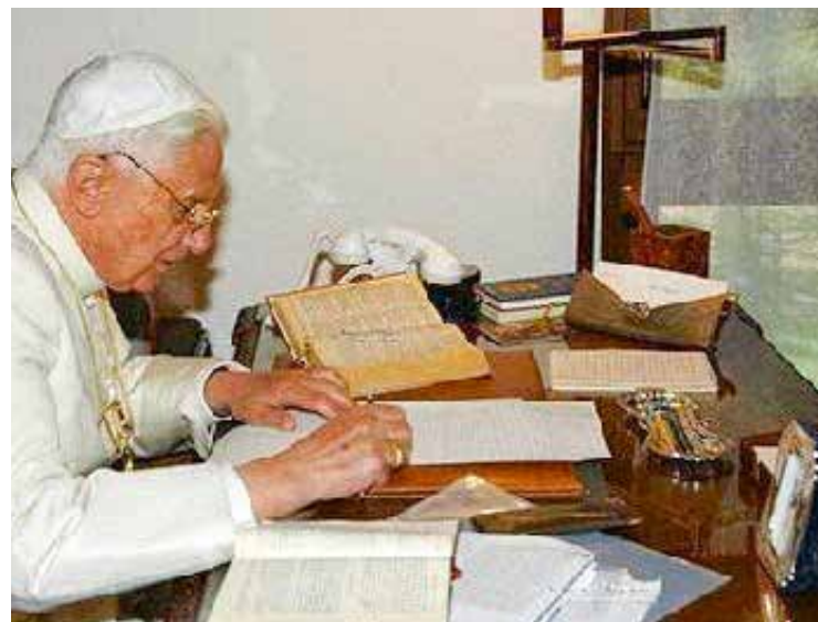
Benedetto XVI nel suo studio

L'umiltà «eroica» di Joseph Ratzinger emerge poi più volte laddove descrive la sua opera teologica e le sue molteplici attività al servizio della Chiesa: lascia sempre che il suo ruolo appaia secondario e insiste invece su quanto fatto da altri. In tutti i campi dove si è trovato a operare, appare evidente il distacco di Benedetto XVI da ogni aspetto mondano e come tutto il suo agire abbia come solo fine quello di servire Cristo e la Chiesa. A questo proposito è particolarmente significativa la sua risposta a una domanda sulla sua condizione dopo la rinuncia al ministero petrino, in cui descrive il suo rapporto con il «potere»: «Non ho mai percepito il "potere" come una posizione di forza, ma