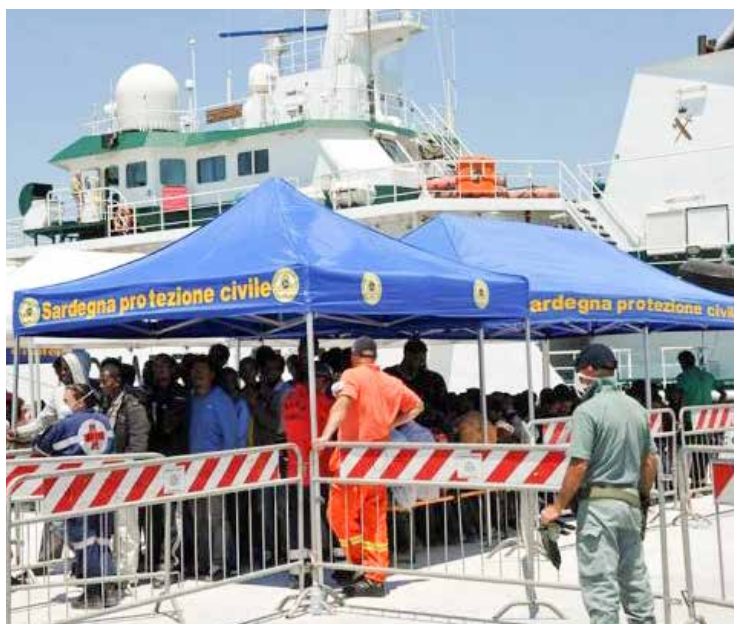
Migranti in arrivo in Sardegna

Non è semplice dare una spiegazione. Bisogna sempre scindere i casi di emigrazione forzata da quella volontaria, dove è la scelta del singolo a portarlo a lasciare il proprio paese. Nel primo caso, invece, si parla di una «scelta obbligata», dove la persona deve lasciare casa sua perché là rischia di morire o essere maltrattata: sono tanti gli esempi di chi stava benissimo nel proprio paese, avendo casa e lavoro, costretto però a doversi andare per i motivi che dicevamo prima. A chi dice «aiutiamoli a casa loro» rispondo: in alcuni casi si può, ma non sempre.