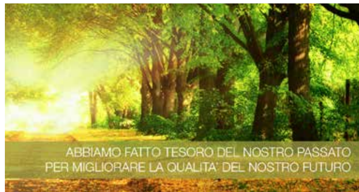
Un'immagine tratta da sito web di Mvt Group