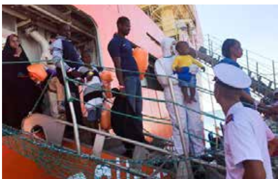
Un recente sbarco di migranti