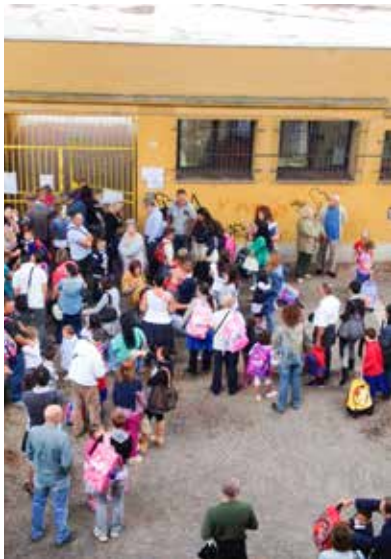
L'ingresso il primo giorno di scuola

Il progetto regionale Iscol@, ormai ai nastri di partenza, si occuperà di questa particolare emergenza, oltre al discorso legato all'incremento delle competenze e alla lotta contro la dispersione scolastica.