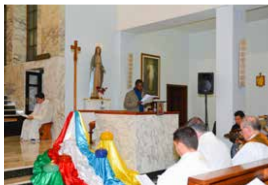
La Veglia missionaria a Sant'Elia