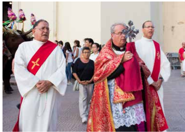
Due momenti dei festeggiamenti