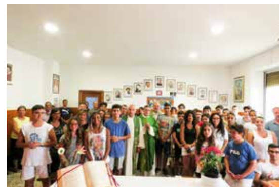
I partecipanti al campo scuola

menticatoio: la Trinità, i Comandamenti, i Sacramenti, la composizione dell'Anno Liturgico, i vizi capitali, le opere di Misericordia fino a toccare, per i più grandi, temi come «Fides et ratio». Prendendo spunto dalle storie di Harry Potter gli animatori hanno saputo coinvolgere i ragazzi in un'avventura ricca di giochi e personaggi dove, nonostante la divisione in squadre e in gruppi di servizio, hanno prevalso il senso di appartenenza ad un gruppo più ampio, mettendo in evidenza la dimensione di Chiesa stessa che opera a vantaggio di un solo gruppo ma mette a disposizione dei fratelli i doni che il Signore stesso gli ha fornito. Questo in piena linea con le Gmg che è uno degli obiettivi a lungo termine per gli alunni della scuola. Questa ricca, ma breve esperienza può essere intravista come una delle possibili vie per educare i giovani a divenire «buoni cristiani e onesti cittadini», che è il fine educativo di ogni Oratorio.