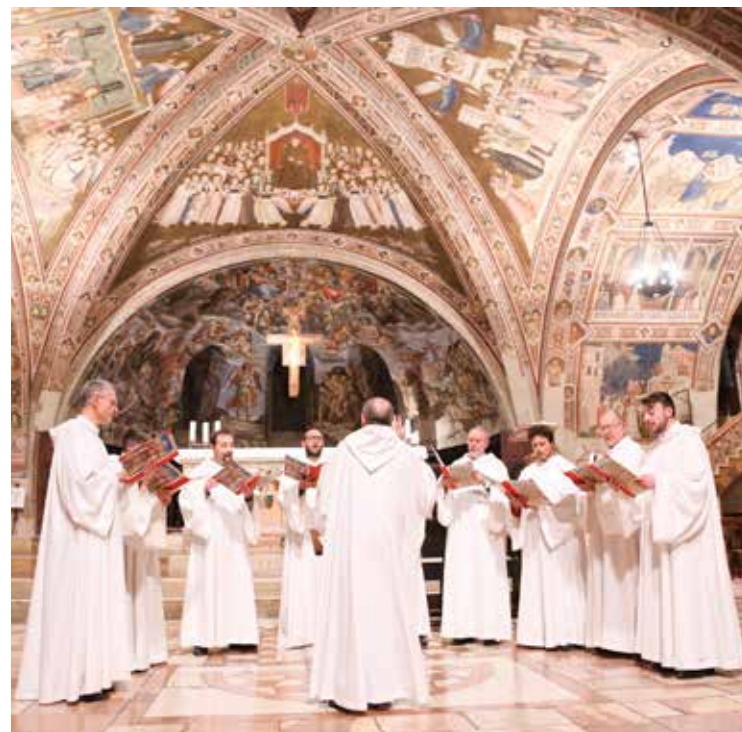
Cantori ad Assisi