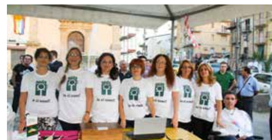
Uno stand di Aisla

L'iniziativa ha lo scopo di raccogliere fondi da destinare al sostegno delle persone colpite da questa malattia, oltre 6000 in Italia. «Un contributo versato con gusto», questo il titolo della raccolta: con un'offerta di 10€ è stato infatti possibile ricevere una bottiglia di vino Barbera d'Asti Docg. Grazie al sostegno di Regione Piemonte, del Consorzio Barbera d'Asti e vini del Monferrato e della Fondazione Cassa di Risparmio di Asti, i volontari di Aisla hanno portato nelle piazze coinvolte oltre 12.000 bottiglie di vino. L'appuntamento di quest'anno era particolarmente importante perché ricorreva il decennale del 18 settembre 2006, data storica in cui le persone con Sla