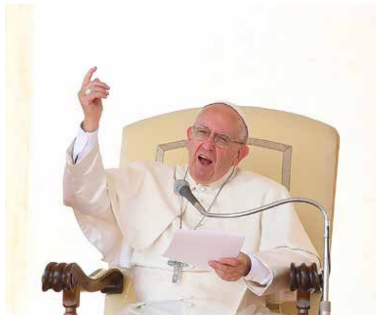
Francesco all'Udienza generale

Ricevendo in udienza l'Associazione biblica italiana, in occasione della Settimana biblica iazionale, papa Francesco ha ripreso il tema