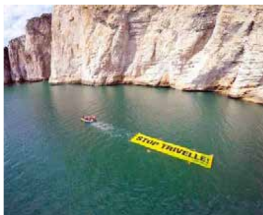
Una manifestazione contro le trivelle