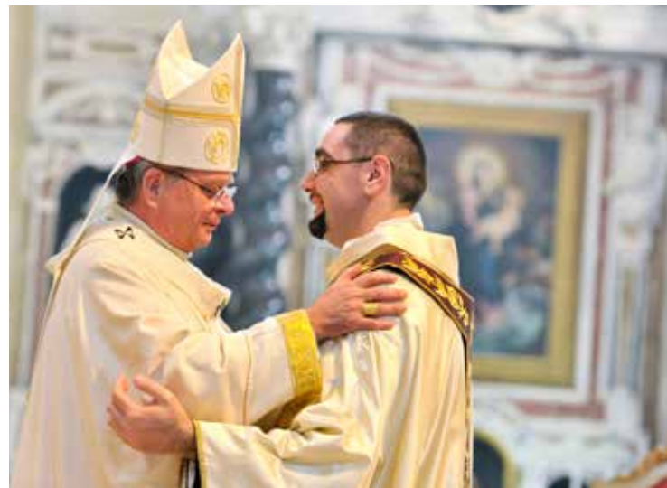
Due momenti della celebrazione