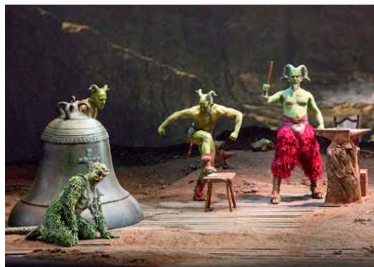
Una scena de «La campana sommersa»

A dirigere è la bacchetta di Donato Renzetti, già a Cagliari per la stagione concertistica e nel cuore del pubblico cittadino per la sublime Traviata del 2014. Renzetti indulge sui forti e sui fortissimi, che riecheggiano dei drammi di Wagner, e, purtroppo, copre varie volte le voci dei cantanti. Ma sa anche risaltare i pianissimi con compat-