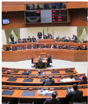
I lavori in Consiglio regionale

Quasi sette miliardi e mezzo di euro per cercare di sostenere la ripresa economica della Sardegna, con il comparto sanitario, come di consueto, a far da principale catalizzatore dei fondi stanziati, nonostante il tentativo di avviare il risanamento del debito da parte della Giunta regionale. È quanto emerge dall'approvazione della nuova legge finanziaria messa a punto dall'esecutivo guidato da Francesco Pigliaru, che mette a disposizione dell'isola oltre 7 miliardi e 400 milioni di euro per favorire lo sviluppo e ridurre il debito accumulato negli anni nel settore della Sanità, voragine non più sostenibile secondo la Giunta, che rosicchia circa trecento milioni in più all'anno rispetto a quanto dovrebbe.