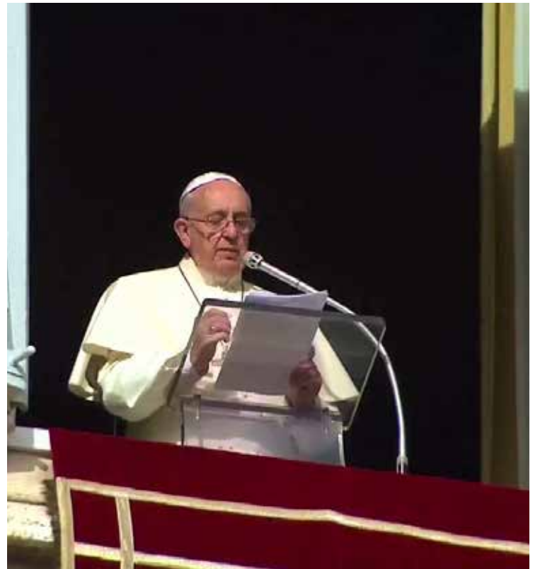
Francesco al Regina Coeli

La spinta decisiva verso la testimonianza della misericordia viene dallo stesso Cristo: «Egli, che con la risurrezione ha vinto la paura e il timore che ci imprigionano, vuole spalancare le nostre porte chiuse e inviarci. La strada che il Maestro risorto ci indica è a senso unico, procede in una sola direzione: uscire da noi stessi, uscire per testimoniare la forza risanatrice dell'amore che ci ha conquistati». Nel discorso durante la veglia di preghiera per il Giubileo di quanti aderiscono alla spiritualità della Divina Misericordia, papa Francesco ha insistito in modo particolare sulla testimonianza della misericordia da portare nel mondo attuale: «La misericordia non può mai lasciarci tranquilli. È l'amore di Cristo che ci "inquieta" fino a quando non abbiamo raggiunto l'obiettivo; che ci spinge ad abbracciare e stringere a noi, a coinvolgere quanti hanno bisogno di misericordia per permettere