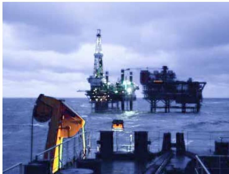
Trivelle in azione

dimostrato nei fatti attenzione e rispetto per la Sardegna e le sue prerogative autonomistiche». Alla fine saranno nove le regioni che risulteranno promotrici e uno soltanto il quesito rimasto. Numerose le associazioni coinvolte, ambientaliste e non come Wwf, Greenpeace, Legambiente, Gruppo di intervento giuridico, Touring Club italiano e l'isolana No trivelle in Sardegna, costola del movimento nazionale No-triv. Il referendum, nella sua semplicità ha però dei possibili risvolti poco chiari: il quesito abrogativo determina la necessità di votare sì per dire no alle trivelle, mentre si vota no se si è a favore del prosieguo delle attività estrattive. Non c'è solo poi la questione di durata di concessioni. I No-triv e i presidenti dei Consigli regionali temono l'ennesimo tentativo da parte del Governo di esproprio di poteri alle regioni e un modo di temporeggiare su scelte di politica energetica che includano le rinnovabili. Le motivazioni sono quindi di natura più profonda: il timore di nuove trivellazioni sembra non sussistere, visto che la legge non ammette nuove ricerche, ma il movimento vuole prendere le distanze anche dalla possibilità che questo sia un cavallo di Troia per concedere autorizzazioni per impianti a poco più di 12 miglia, già