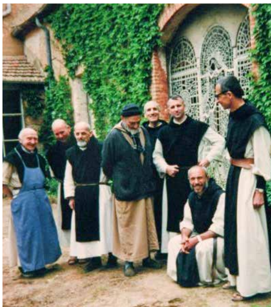
I monaci trappisti sequestrati e uccisi a Tibhirine (Algeria)

La testimonianza di fede dei monaci di Tibhirine e la loro esperienza di fraternità in terra algerina, in un'epoca segnata da forti conflitti causati dal radicalismo islamista, mantengono una forza profetica preziosa per il nostro tempo segnato spesso dal tradimento tragico di ogni ideale religioso, quando questo diviene il falso pretesto per azioni legate all'odio e alla violenza. La loro esperienza si lega anche agli insegnamenti di papa Francesco sulla pace e il dialogo interreligioso. Basti pensare alle sue parole in occasione dell'ultimo Giovedì Santo, nella Messa «In Coena Domini»: «Quando io farò lo stesso gesto di Gesù di lavare i piedi a voi dodici, tutti noi stiamo facendo il gesto della fratellanza, e tutti noi diciamo: Siamo diversi, siamo differenti, abbiamo differenti culture e religioni, ma