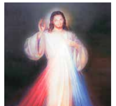
L'immagine di Gesù Misericordioso

Tre anni dopo a Vilnius Gesù ha spiegato il significato dei raggi: «I due raggi rappresentano il Sangue e l'Acqua». La liturgia della seconda domenica di Pasqua ci fa leggere proprio il brano del Vangelo di Giovanni in cui Gesù risorto, apparendo il giorno di Pasqua ai suoi discepoli rinchiusi nel Cenacolo, conferisce il mandato di rimettere i peccati e istituisce il sacramento della Riconciliazione (cfr Gv 20, 19,29). All'immagine del Gesù Misericordioso spesso viene identificata come quella della Divina Misericordia e giustamente poiché, nella passione, morte e risurrezione di Cristo la misericordia di Dio verso l'uomo si è rivelata con totale pienezza. Nella celebrazione giubilare, dopo esser passati per la porta della Misericordia, è stata celebrata la