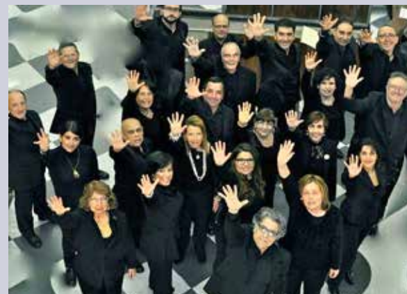
Il Collegium Kalaritanum

I cinque appuntamenti, organizzati dall'Associazione Incontri Musicali, in collaborazione con il Collegium Kalaritanum e patrocinati dall'Assessorato della Pubblica Istruzione della Regione Sardegna, rappresentano un interessante possibilità di assistere a esibizioni di alta qualità musicale e culturale e contribuiscono alla raccolta fondi a favore della Caritas.