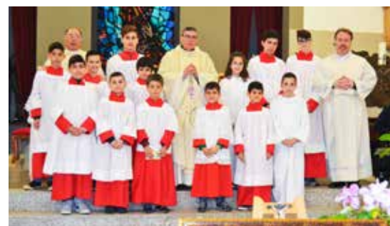
Foto di gruppo dei nuovi ministranti

È sempre una grande gioia vedere con quale impegno, generosità e puntualità questi ragazzi si adoperano nel servizio all'altare, secondo l'esempio di Gesù che non ha esitato Egli stesso a servire per primo e che invita a fare anche noi la medesima cosa amando i nostri fratelli. Il termine ministrante ha sostituito col tempo il termine «chierichetto» poiché riesce a