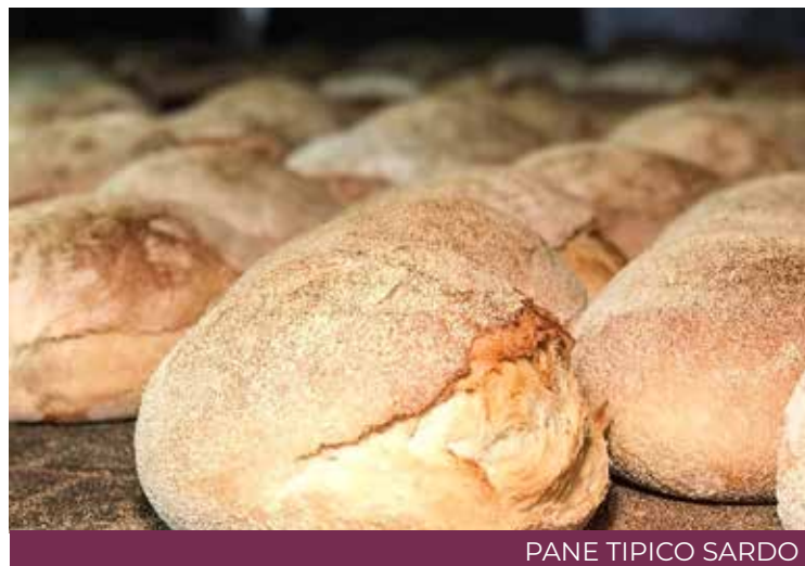
PANE TIPICO SARDO

Il risultato che ne scaturisce è di gran lunga un valore aggiunto per il consumatore, il quale, senza costi aggiuntivi, sarà in grado di controllare la genuinità del prodotto in totale trasparenza e affidabilità.