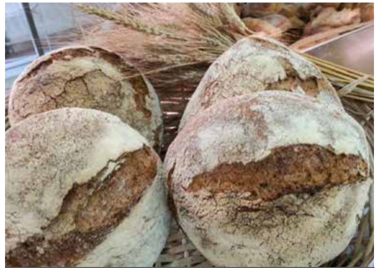
TIPICO PANE SARDO

Per Confartigianato Sardegna è necessario proteggere l'attività di panificazione e migliorare l'informazione al consumatore, la sua salute e, soprattutto, è fon-