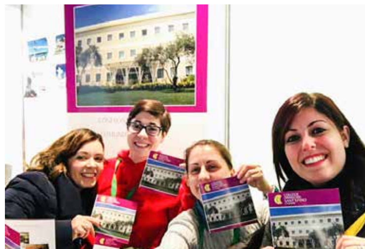
ALCUNE RAGAZZE DEL COLLEGE

La vita comunitaria è stimolata da diversi momenti di aggregazione e attività, a libera adesione del singolo, come cineforum, attività di volontariato, incontri di approfondimento su specifiche tematiche, uscite culturali sul territorio regionale e nazionale, riunioni periodiche di aggiornamento sulla