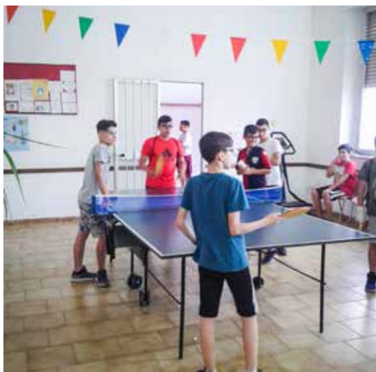
I GIOVANI DURANTE LE ATTIVITÀ RICREATIVE

certo senso, il lavoro terminerà, consentendo così agli animatori di poter tirare il fiato, in attesa di riprendere il nuovo anno pastorale, nel quale continuare a offrire la consueta opportunità ai bambini e alle bambine che frequentano l'oratorio.