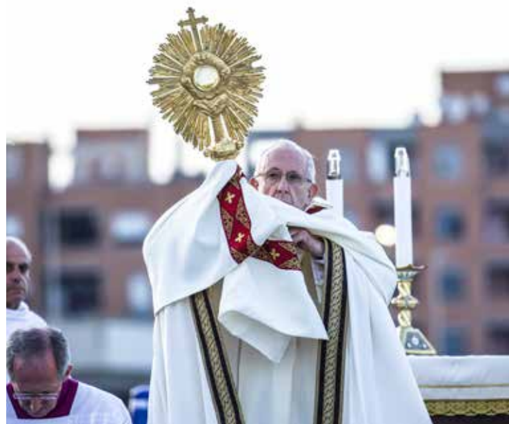
IL PONTEFICE CELEBRA LA SOLENNITÀ DEL CORPUS DOMINI

che, in una diversa prospettiva religiosa o senza un credo specifico, riconoscono la dignità e l'eccellenza della persona umana quale criterio della loro attività». Il riconoscimento della dignità del malato deve guidare l'azione dei medici: «Voi siete chiamati ad affermare la centralità del malato come persona e la sua dignità con i suoi inalienabili diritti, in primis il diritto alla vita. Va contrastata la tendenza a svilire l'uomo malato a macchina da riparare, senza rispetto per principi morali, e a sfruttare i più deboli scartando quanto non corrisponde all'ideologia dell'efficienza e del profitto. [...] Sia vostra cura impegnarvi nei rispettivi Paesi e a livello internazionale, intervenendo in ambienti specialistici ma anche nelle discussioni che riguardano le legislazioni su temi etici sensibili, come ad esempio l'interruzione di gravidanza, il fine-vita e la medicina genetica. Non manchi la vostra sollecitudine anche a difesa della libertà di coscienza, dei medici e di tutti gli operatori sanitari. Non è accettabile che il vostro ruolo venga ridotto a quello di semplice esecutore della volontà del malato o delle esigenze del sistema sanita-