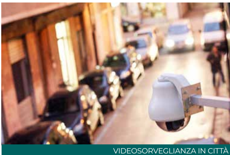
VIDEOSORVEGLIANZA IN CITTÀ