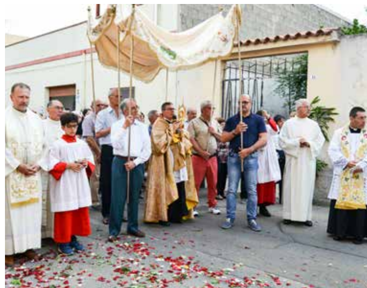
LA PROCESSIONE INTERPARROCCHIALE

Ai genitori, ricordando la prima Comunione di don Bosco a cui fu preparato dalla mamma Margherita, li ha spronati a continuare nell'impegno educativo dei propri