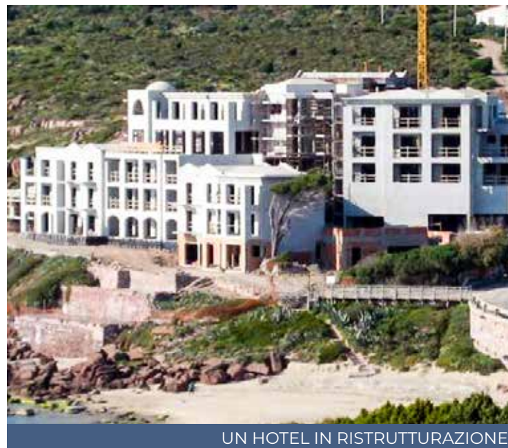
UN HOTEL IN RISTRUTTURAZIONE

Il presidente di Confesercenti spiega come siano «colate di cemento che vengono autorizzate con disinvoltura, anche in piccole realtà dove sarebbero del tutto superflue, e soprattutto laddove il mercato è saturo. «Innamorarsi - sottolinea - del concetto di turismo di qualità ma avere alberghi postdatati è una contraddizione alla volontà regionale di sviluppare un settore che rappresenta già un traino per l'economia della nostra regione. Rispetto ai nostri competitor non siamo affatto adeguati agli stan-