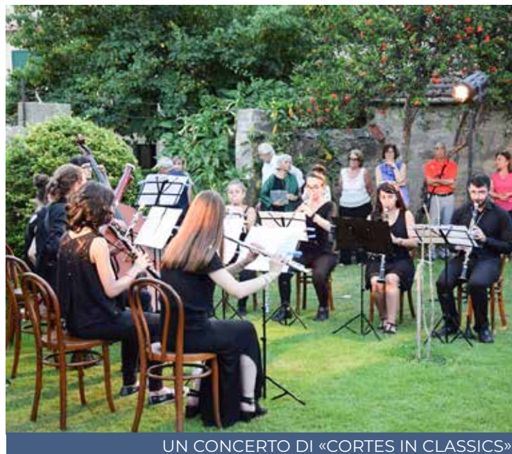
UN CONCERTO DI «CORTES IN CLASSICS»

Certamente. C'è un aspetto molto importante da tener presente. Vengono scelti piccoli centri, sebbene importanti. Il primo era stato Laconi, il secondo Doliano-