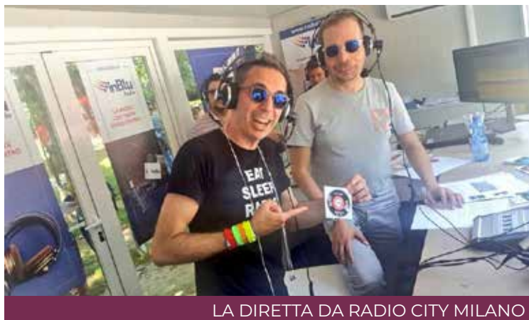
LA DIRETTA DA RADIO CITY MILANO

Un grande incontro della radiofonia italiana e internazionale. «Radio City», celebrato nei giorni scorsi a Milano, ha visto la presenza delle più importanti radio della Penisola, tra le quali anche il circuito «InBlu