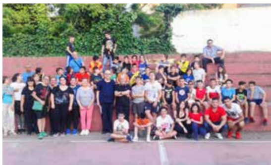
IL GRUPPO DELL'ORATORIO DI SAN GIORGIO

A san Giorgio di Sestu quest'anno le attività proseguiranno fino al 3 agosto, momento nel quale in un