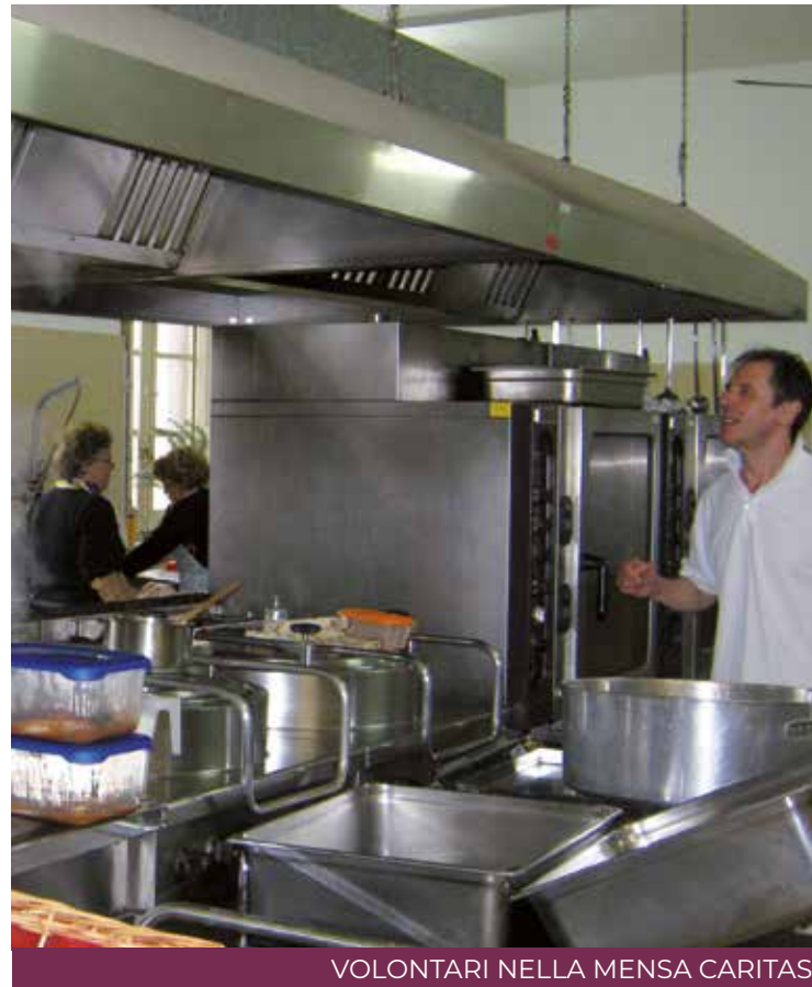
VOLONTARI NELLA MENSA CARITAS

Il primo è «Antenne dell'ascolto Cagliari», progetto di sostegno rivolto alle persone adulte che usufruiscono del servizio nel Centro di ascolto diocesano. Il secondo «Ecoute Moi - Cagliari», progetto di sostegno rivolto alle persone immigrate e profughe attraverso il servizio nel Centro di Ascolto per stranieri «Kepos». Ce ne poi un terzo che ha per nome «È pronto per te! Cagliari», progetto di sostegno rivolto alle persone adulte che usufruiscono del servizio della mensa diocesana e del centro