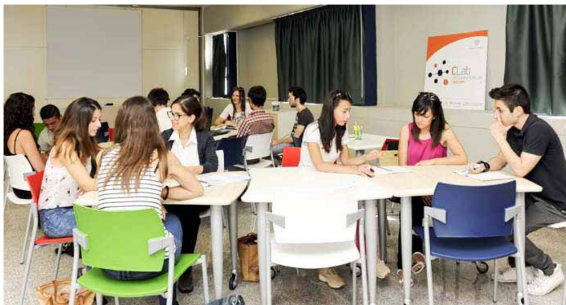
GIOVANI IMPEGNATI NEL CONTAMINATION LAB