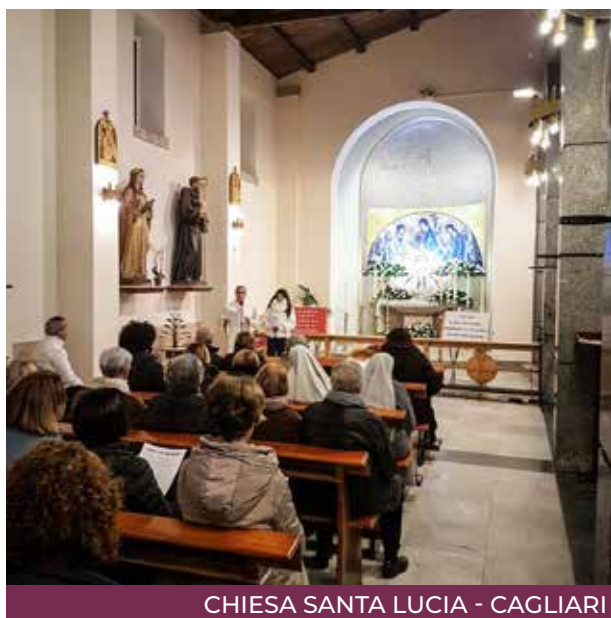
CHIESA SANTA LUCIA - CAGLIARI