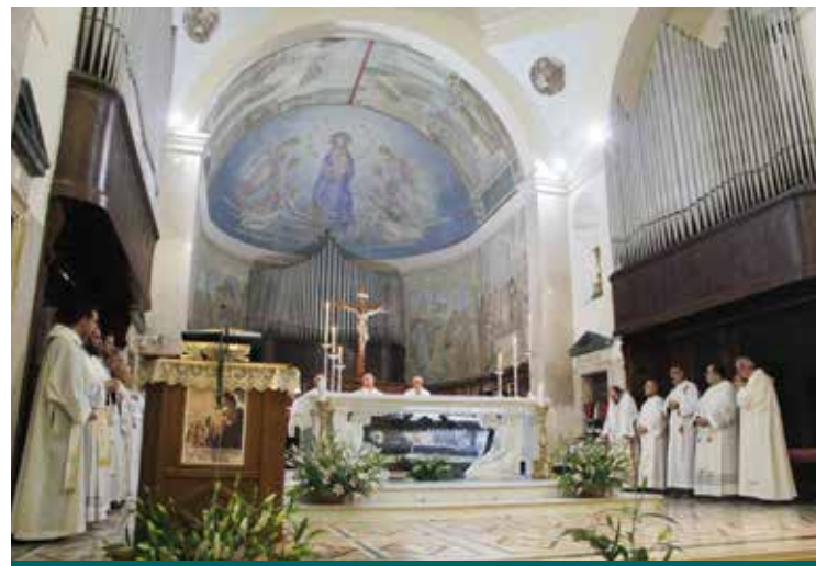
UNA CELEBRAZIONE A SANTA ROSALIA

Studi storici e scientifici di notevole portata e altre pubblicazioni più semplici vengono offerte proprio in queste in queste settimane. Ne segnaliamo alcuni: «Salvatore da Hor-