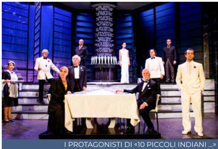
I PROTAGONISTI DI «10 PICCOLI INDIANI...»