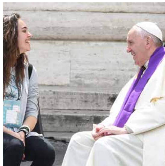
FRANCESCO CONFESSA UNA GIOVANE

Con tali disposizioni da parte dei sacerdoti, ha concluso il Pontefice, «il colloquio della confessione sacramentale diventa così occasione privilegiata di incontro, per porsi entrambi, penitente e confessore, in ascolto della volontà di Dio, scoprendo quale possa essere il suo progetto, indipendentemente dalla forma della vocazione. Infatti, la vocazione non coincide, né può mai coincidere, con una forma! Questo porterebbe al formalismo! La vocazione è il rapporto stesso con Gesù: rapporto vitale e imprescindibile».