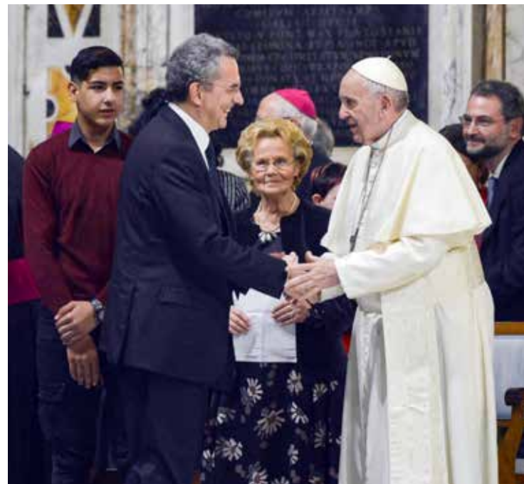
FRANCESCO NELLA COMUNITÀ DI SANT'EGIDIO

In settimana, all'Udienza generale, il Papa si è concentrato sulla preghiera eucaristica.