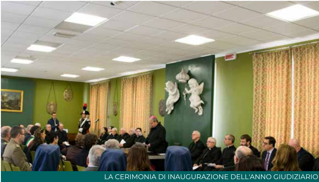
LA CERIMONIA DI INAUGURAZIONE DELL'ANNO GIUDIZIARIO