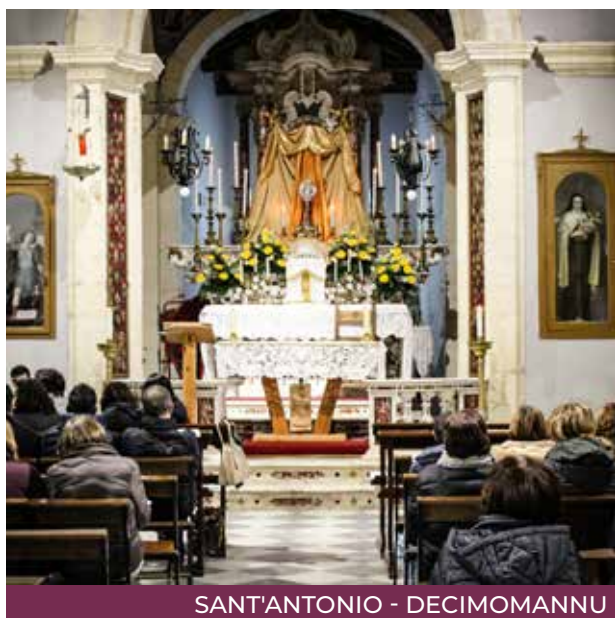
SANT'ANTONIO - DECIMOMANNU

Il 9 e 10 marzo si sono celebrate «Le 24 ore per il Signore», l'iniziativa nata cinque anni fa su iniziativa del Pontificio consiglio per la Nuova Evangelizzazione. Anche in diocesi sono state diverse le parrocchie che hanno aderito all'invito di dedicare del tempo alla preghiera davanti all'Eucaristia, con una buona presenza di fedeli molti dei quali giovani, segno di una Chiesa viva che vuole continuare a essere presenza importante tra la gente.