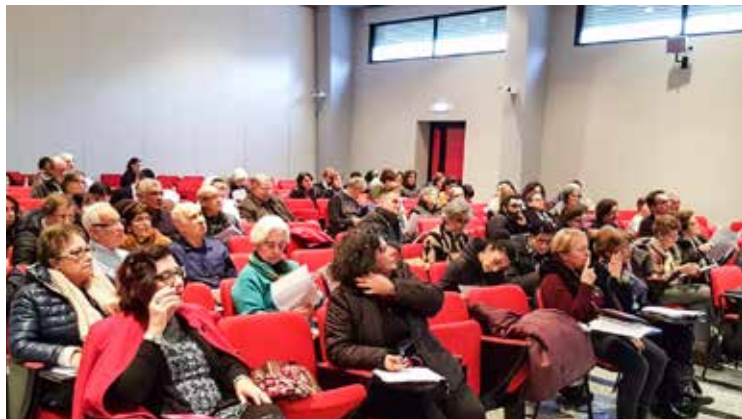
UNO DEGLI INCONTRI IN SEMINARIO

Crederenti sempre più coscienti del mistero che viene celebrato nella liturgia. È uno dei motivi che ha spinto l'Ufficio liturgico diocesano a realizzare tre incontri di forma-