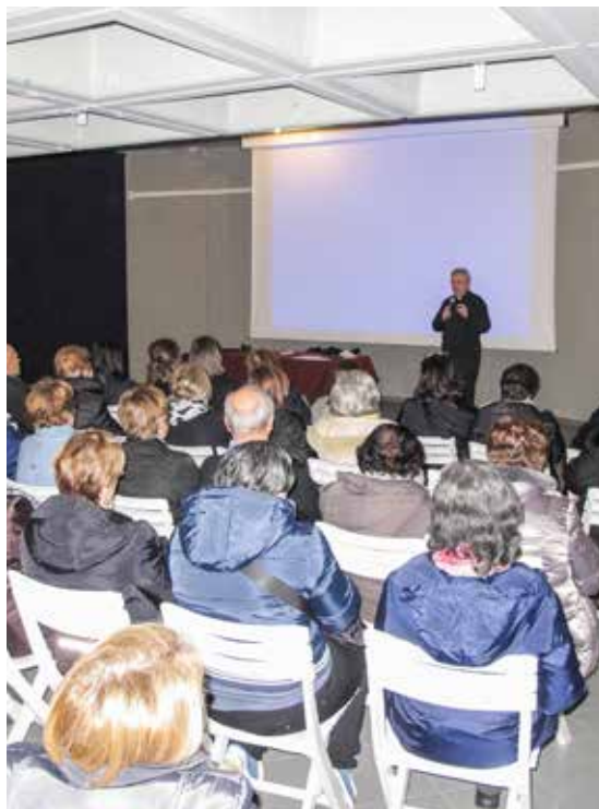
UN INCONTRO DELL'ASSEMBLEA PERMANENTE

Con questo auspicio sono iniziati quindi i lavori nell'Assemblea parrocchiale permanente, suddi-