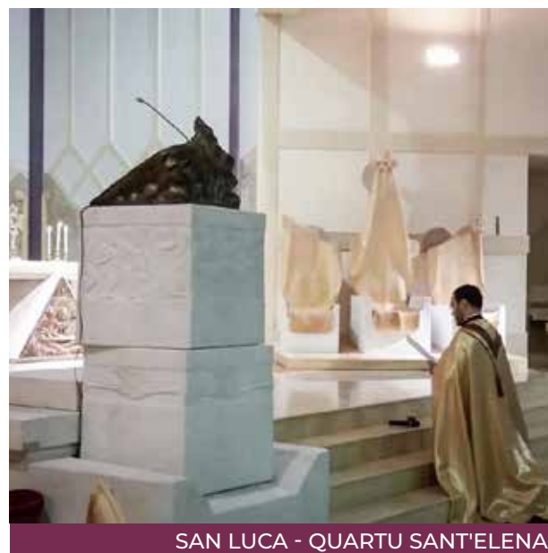
SAN LUCA - QUARTU SANT'ELENA