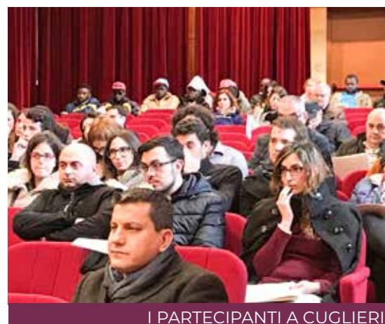
I PARTECIPANTI A CUGLIERI