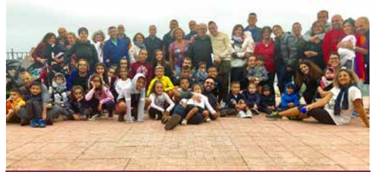
LE FAMIGLIE A FONNI

Alla base di tutto il percorso, il presupposto che il matrimonio cristiano è fondato oltre che sull'a-