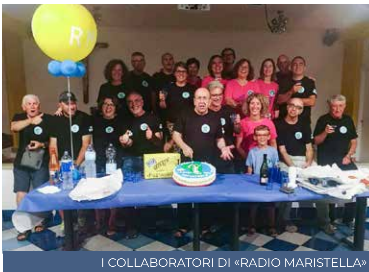
I COLLABORATORI DI «RADIO MARISTELLA»

Ha festeggiato i 40 anni dalla nascita «Radio Maristella», emittente comunitaria della parrocchia san Carlo Borromeo di Carloforte, una delle più longeve