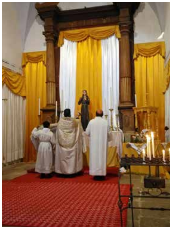
L'INTRONIZZAZIONE DELLA SANTA

Il legame tra i nurresi e santa Rosa è forte. Basterebbe presenziare ad una delle celebrazioni del novenario o del triduo, per comprendere come sia