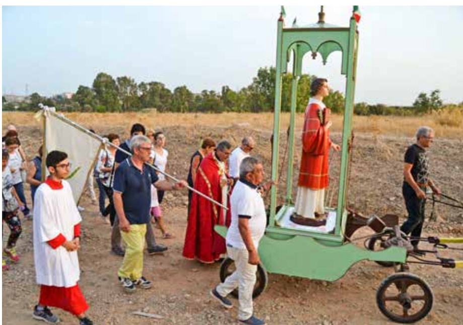
LA PROCESSIONE DI SAN LORENZO