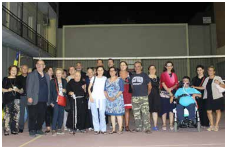
IL GRUPPO DELLA SS. ANNUNZIATA

Nelle parrocchie di san Francesco e della SS. Annunziata a Cagliari, la milizia dell'Immacolata ha commemorato il 78mo anniversario del transito e martirio del fondatore,