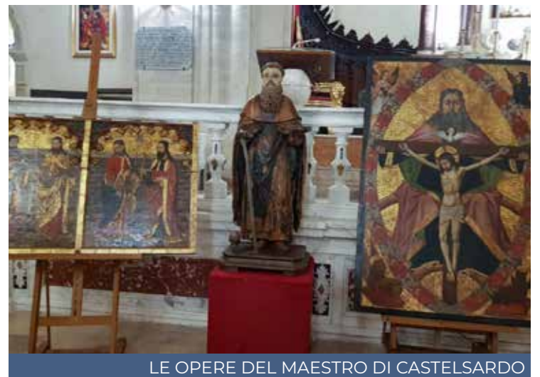
LE OPERE DEL MAESTRO DI CASTELSARDO

mondiali come la Galleria degli Uffizi e l'opificio delle pietre dure di Firenze, l'University of Sulaimani in Iraq ed il San Gemini, International Studies of Preservation, di New York. Tutte le ricerche portano alla conferma delle ipotesi fatte osservando le assonanze stilistiche. Se il viso della statua ricorda quello degli apostoli, dipinti nella predella, ed il libro che tiene in mano l'apostolo Bartolomeo sembrava proprio uguale a quello che tiene in mano la statua di sant'Antonio, dalla spettroscopia Raman arriva la conferma. I pigmenti sono gli stessi, così come, sicuramente, la mano che li ha stesi. Nello scorcio del XV secolo, quindi, il vetusto piccolo priorato di Sant'Antonio Abate, succursale dell'abbazia casinese di Tergu, edificato ai margini dell'abitato, fu quindi arricchito di un imponente retablo, simbolo della nuova dignità assunta dall'edificio sacro, promosso a Cattedrale con il trasferimento della sede vescovile Castellaragonese. Ma, se non è certa la data della sua realizzazione, sappiamo invece quando l'opera viene smontata, alla fine del 1500, perché considerata, come succede spesso nella storia