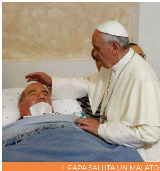
IL PAPA SALUTA UN MALATO