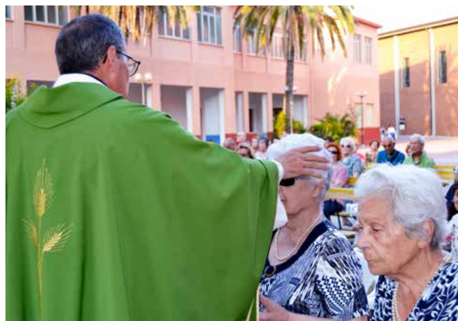
L'UNZIONE DEGLI INFERMI