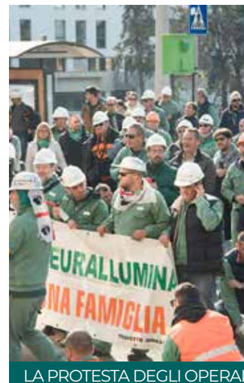
LA PROTESTA DEGLI OPERAI

Una notizia ben accolta dei rappresentanti dei lavoratori, i quali hanno chiesto di velocizzare la procedura di autorizzazione per la valutazione di impatto ambientale (Via), in modo che possa arrivare alla soluzione definitiva.