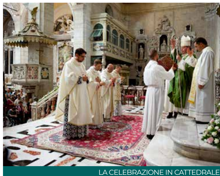
LA CELEBRAZIONE IN CATTEDRALE