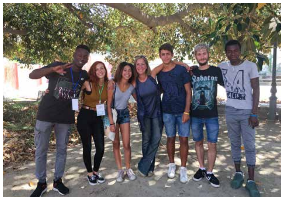
GIOVANI IN SERVIZIO A VILLA ASQUER