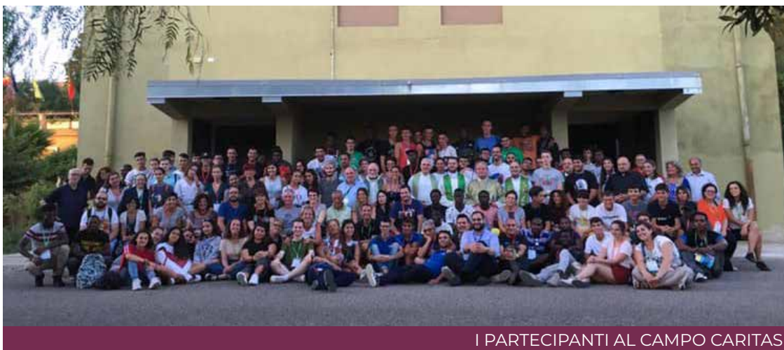
I PARTECIPANTI AL CAMPO CARITAS