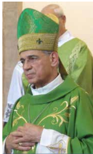
MONS. MOSÈ MARCIA

gesto ci qualifica come cristiani». Un'indicazione chiara a vivere il momento di passaggio con serenità e con gratitudine per chi ha servito la Chiesa nuorese e con fiducia e speranza per chi si appresta a prenderne la guida. Il 15 settembre arriverà il nuovo pastore della Chiesa nuorese: monsignor Antonello Mura, diventato amministratore apostolico della diocesi di Lanusei, dopo la nomina alla guida della diocesi barbaricina. L'ingresso il pomeriggio del 15 prevede la visita al monastero «Mater Salvatoris» delle Carmelitane Scalze, quella alla Casa circondariale di «Badu