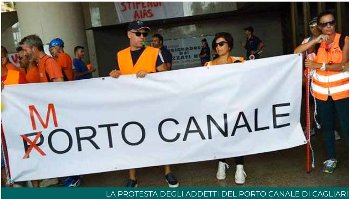
LA PROTESTA DEGLI ADDETTI DEL PORTO CANALE DI CAGLIARI