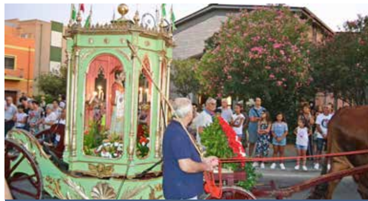
LA PROCESSIONE DI SAN LORENZO

Dal 7 al 12 agosto i festeggiamenti in onore di san Lorenzo sono iniziati con la processione nella chiesa cam-