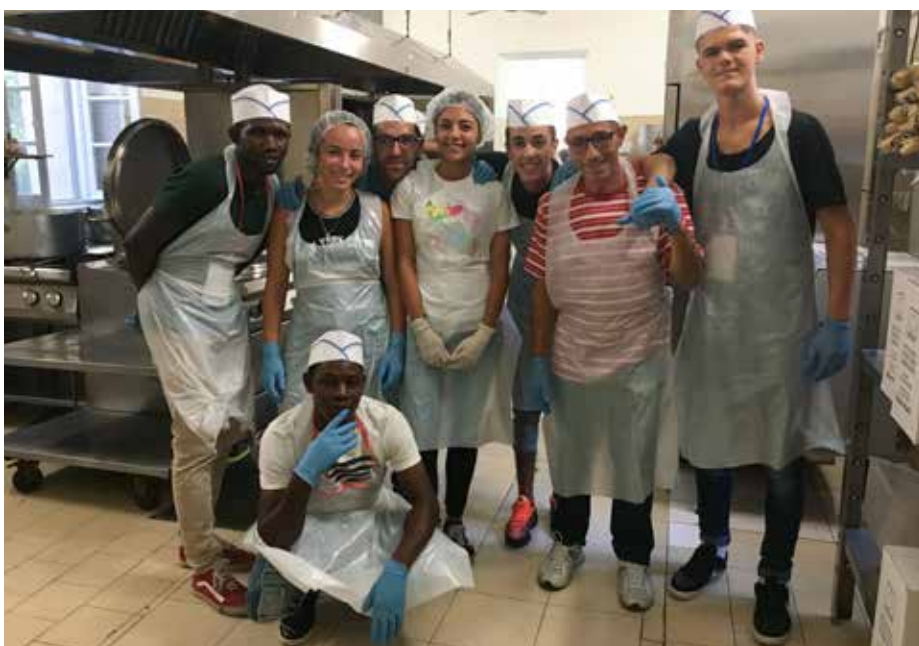
GIOVANI IN SERVIZIO NELLA CUCINA DELLA CARITAS