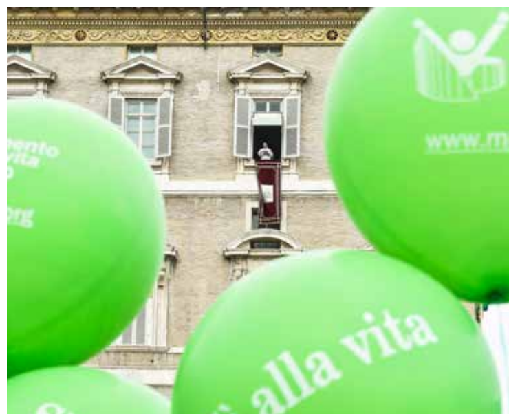
Francesco all'Angelus nella Giornata per la Vita

Per i cristiani la speranza non è semplicemente «qualcosa di bello che desideriamo, ma che può realizzarsi oppure no», è invece «l'attesa di qualcosa che già è stato compiuto»: «La speranza cristiana è l'attesa di una cosa che è già stata compiuta e che certamente si realizzerà per ciascuno di noi. Anche la nostra risurrezione e quella dei cari defunti, quindi, non è una cosa che potrà avvenire oppure no, ma è una realtà certa, in quanto radicata nell'evento della risurrezione di Cristo.