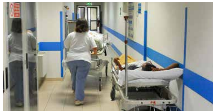
Una corsia di ospedale