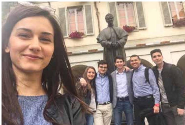
La trasferta a Torino

Nessuna cerchia chiusa: partecipare alle iniziative della Pastorale universitaria non richiede nessuna adesione formale, ma ciascuno, in piena libertà, sceglie di aderire alle iniziative che ritiene importanti per il suo cammino umano e di fede. In questo senso le iniziative sono aperte a tutti: cristiani, non credenti, credenti di altre religioni. Ciò che è richiesto è solo un desiderio autentico di mettersi in gioco.