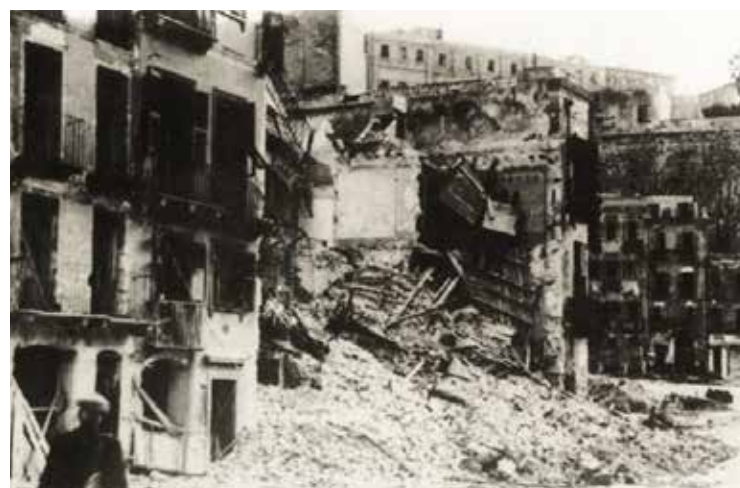
Piazza Yenne, angolo Corso Vittorio Emanuele dopo i bombardamenti

Il drammaturgo definisce lo spettacolo che rievoca i bombardamenti su Cagliari «un folle volo lungo venticinque anni, dove si torna da una guerra e si parte per