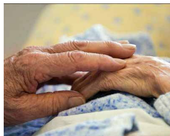
Al servizio della fragilità e della malattia

corso la teologia dogmatica insieme agli elementi di pastorale sanitaria, alla luce della quale chi frequenterà verrà formato. «Il mio invito — dice — è rivolto soprattutto a chi si occupa di pastorale della salute, almeno delle realtà di Cagliari e dintorni. Questo andrebbe anche nella direzione auspicata dalla Conferenza episcopale italiana che chiede la presenza nelle singole parrocchie, oltre che di una Caritas o di un percorso formativo di iniziazione cristiana, anche di chi si occupa di Pastorale della salute, che collabori con il sacerdote nel servizio ai malati. Questa non è una realtà che riguarda solo gli anziani ma tutti: giovani, famiglie, bambini, tutti facciamo i conti con la fragi-