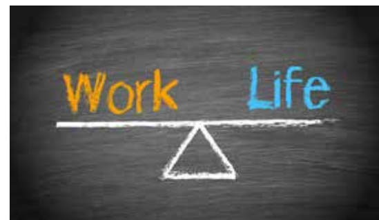
Il difficile equilibrio tra lavoro e vita privata