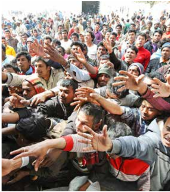
Migranti appena sbarcati

I paesi ricchi non possono eludere la loro parte di re-