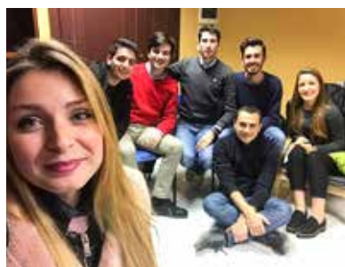
L'equipe di pastorale universitaria

Per la Pastorale è molto importante che si venga a creare un rapporto interpersonale fra universitari e futuri universitari: in questo modo i primi potranno diventare importanti figure di riferimento su cui contare per consigli o conforto. Durante gli incontri, il team racconterà le difficoltà avute da ciascuno, ad esempio nel cambiare metodo di studio o stile di vita. Ma soprattutto si parlerà di soddisfazioni e di successi tanto attesi, che ripagano ogni sacrificio e che spingono ad andare avanti nonostante i tanti ostacoli. Ovviamente ci renderemo disponibili e ci impegneremo a rispondere ai vari quesiti. La speranza di questo progetto è di riuscire