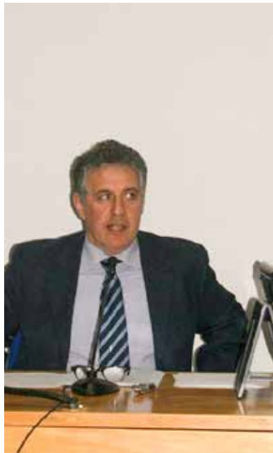
Il magistrato Nino Di Matteo

«Nel libro «Collusi» — ha spiegato Di Matteo — non troverete novità, ma quello che è venuto fuori da sentenze definitive di condanna. Noi, Stato, dobbiamo capire che, per vincere la guerra contro la mafia, dobbiamo recidere i rapporti che ha con la politica. I mafiosi sono stati teste pensanti, sono abili strateghi che hanno la capacità di elaborare i programmi e instaurare rapporti con chi non è mafioso. Un collaboratore di giustizia mi ha detto: «Se noi non avessimo avuto rapporti di collusione con il potere saremmo stati una banda di sciacalli». Ecco perché è decisivo il rapporto con la politica in particolare. Per vincere la guerra dobbiamo trovare questa consapevolezza». Per Di Matteo ci sono stati dei passi in avanti col sacrificio di pochi magistrati e dei componenti delle forze dell'ordine. Quasi tutti i capi sono stati processati, ma oggi bisogna fare il salto di qualità. «Dobbiamo sanzionare — ha concluso il magistrato — chi è ancora disponibile all'interno dell'organizzazione mafiosa».