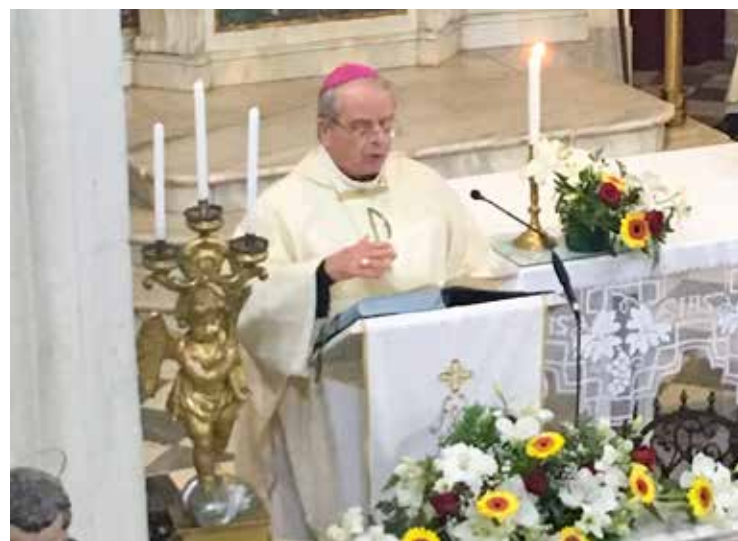
Due momenti della visita di monsignor Miglio a Nuraminis