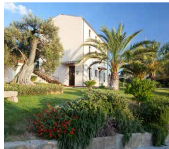
La sede de «La Collina» a Sordiana

Evidentemente neppure il vantaggio economico muove le cose, come avviene in vari altri casi. Basti pensare alle scuole paritarie, nelle quali, per ogni bambino e ragazzo, la spesa si riduce a un quinto rispetto a quella di un alunno delle scuole statali. Nel caso della comunità di Sordiana continua a ri-