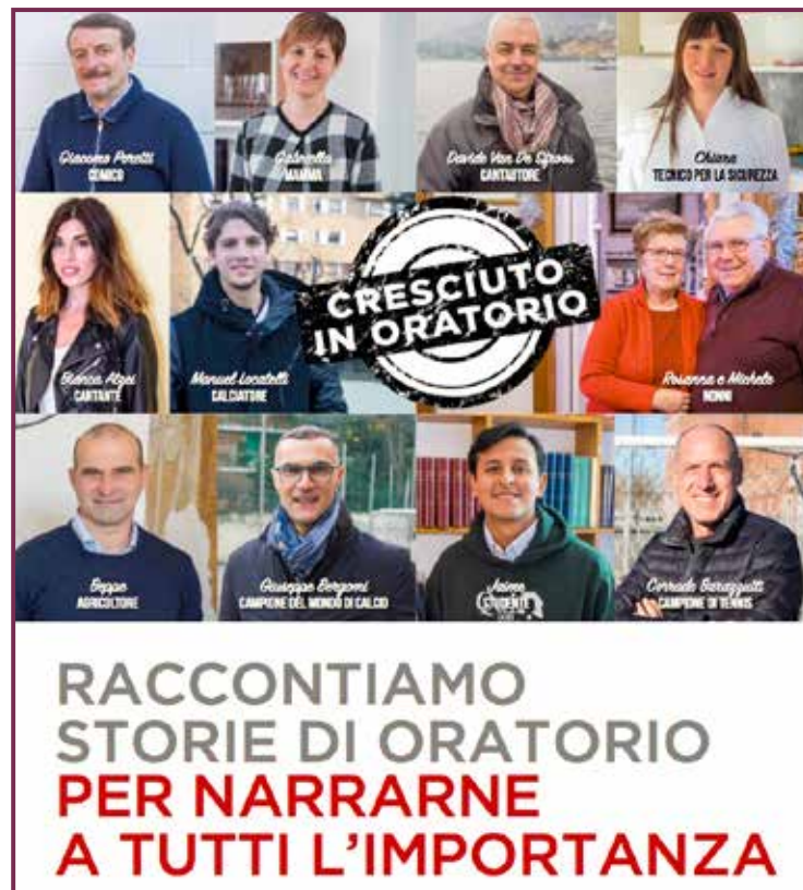
La locandina dell'iniziativa

La campagna, proprio grazie alla sua connotazione «social», avrà un sicuro impatto anche nel resto del territorio nazionale dove, da sempre, gli oratori lombardi sono visti come modelli a cui ispirarsi e fare riferimento per la formazione degli animatori, la bellezza delle iniziative estive e la qua-