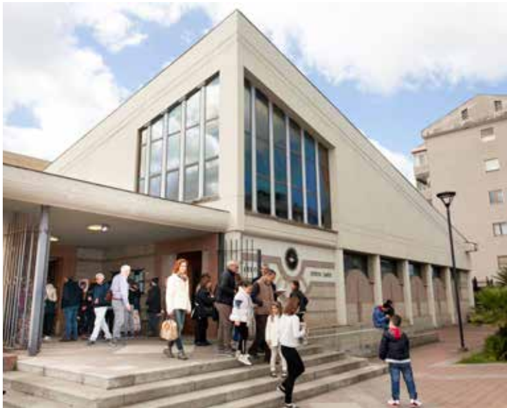
Fedeli all'uscita dalla parrocchia dello Spirito Santo

Per chi fosse interessato può prendere contatto con l'Ufficio diocesano Comunicazioni sociali alla mail ucs@diocesidicagliari.it , oppure al numero 070/523162.