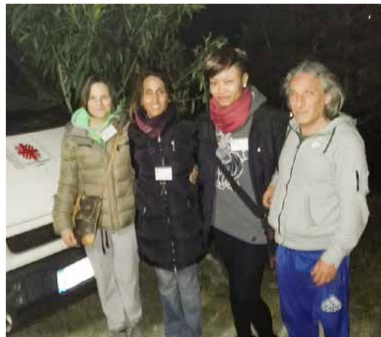
Gli operatori dell'unità di strada anti-tratta della Caritas