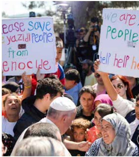
Il Pontefice incontra i profughi a Lesbo

Nel viaggio di ritorno, Francesco, rivolto ai giornalisti ha detto: «Voglio raccontare la storia di un uomo giovane, non ha 40 anni, lui è musulmano e mi ha raccontato che era sposato con una ragazza cristiana,