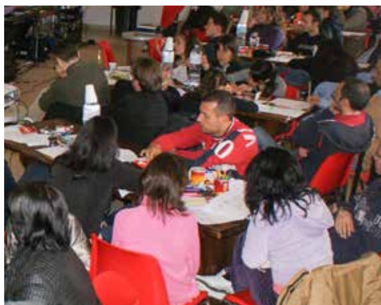
Giovani impegnati in un Tlc

Circa 70 partecipanti hanno animato l'edizione 2016 del Tlc Musicale. Un percorso iniziato 13 anni fa e che continua ad attirare giovani desiderosi di formarsi spiritualmente nel campo dell'animazione liturgica musicale. Quest'anno ha partecipato all'iniziativa, organizzata dal 14 al 17 aprile nella casa dei padri Saveriani di Cagliari, Daniele Ricci, noto compositore, autore di diversi brani eseguiti nel corso delle liturgie che animano anche le nostre parrocchie. «È stata un'esperienza più che positiva – afferma don Nicola Ruggeri, padre spirituale di questa edizione – anche grazie all'elevato numero di giovani che hanno preso parte a questa edizione. Si è formata davvero una piccola, ma grande, comunità. Abbiamo vissuto giorni caratterizzati da una forte e viva emozione, con tanto coinvolgimento, anche grazie al direttore musicale Daniele Ricci, molto conosciuto nell'ambito dell'animazione liturgica musicale. Lui stesso, come uomo di fede e di grande esperienza spirituale, ha contagiato tutti con la sua gioia, che nasce, e non poteva essere altrimenti, dal suo incontro con Cristo». Da 13 anni ormai il Tlc segue un percorso ormai ampiamente collaudato, che ha nell'incontro e nel coinvolgimento diretto i suoi elementi più caratterizzanti. E questi aspetti sono poi trasmessi, grazie a chi decide di partecipare a questo percorso, alle singole realtà parrocchiali, dove i ragazzi operano quotidianamente e rendono il loro tempo libero prezioso