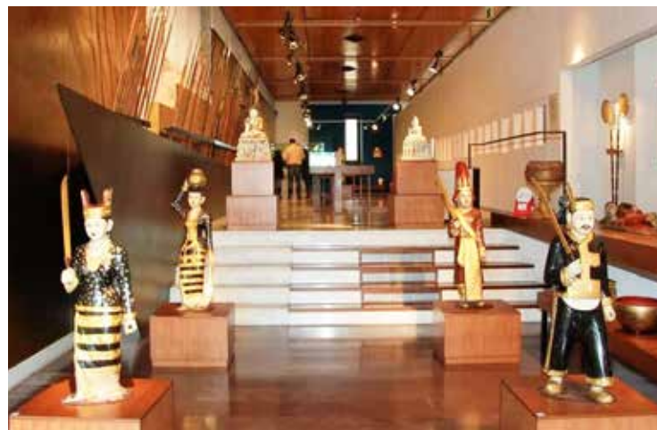
Una delle sale espositive del museo Cardu

Cinque splendidi libri manoscritti e tempere miniate che raccontano le imprese di Hanuman, con forme vegetali e geometriche.