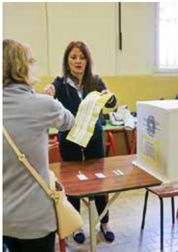
La votazione in un seggio

Questo dal punto di vista delle conseguenze pratiche. L'analisi politica, invece, deve partire dai 13.334.754 elettori che hanno votato «sì» e ai quali è necessario garantire la giusta considerazione. Giova riflettere, pertanto, su alcuni elementi sostanziali che hanno