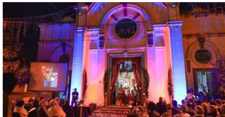
La serata di preghiera per Sant'Efisio