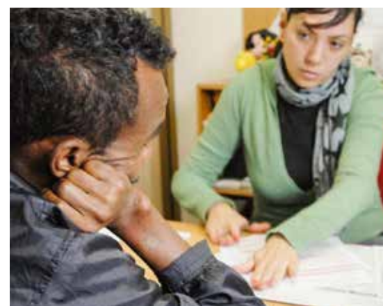
Il lavoro in un centro d'ascolto

valutare le situazioni concrete dell'uomo che abita il territorio in oggetto. I dati ci vengono offerti da varie fonti statistiche, da valutare con ocularità, ma anche dagli stessi soggetti che abitano il territorio. La Caritas si mette al servizio dell'uomo che abita, vive il territorio, legge il malessere presente in esso, lo denuncia e propone, in sinergia e collaborazione con le istituzioni, rispettando il criterio della sussidiarietà, rimedi capaci di affrontare i problemi dell'uomo. La Caritas incontra quindi il territorio e si rende strumento di crescita attraverso l'ascolto delle persone conoscendo quindi storie concrete di vita. I servizi offerti e animati dal vo-