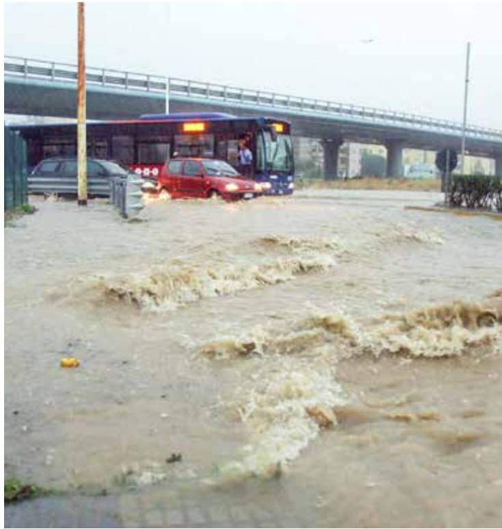
L'incrocio allagato di via Peretti a Cagliari

La pianificazione territoriale va effettuata in modo attento e oculato, in base anche agli strumenti disponibili: in questi anni si è parlato tanto del Piano di assetto idrogeologico, che mette in relazione sensibilità e criticità del territorio con la possibilità o meno di realizzare un determinato intervento. Va detto che oggi la Regione, ottemperando a direttive nazionali, ha predisposto il Piano di gestione del rischio alluvioni. È uno strumento di estrema importanza perché codifica quanto detto prima in caso di alluvioni o frane. È molto curato dal punto di vista idraulico ma carente su quello geologico. Un esempio è la poca attenzione al cosiddetto «trasporto solido», ossia quando un fiume in un evento calamitoso esonda portando con sé acqua e detriti. Anche sulle frane il Piano in questione è carente: per questo denunciavamo quelle che, a nostro avviso, sono mancanze della pianificazione regionale. Alcuni strumenti sono stati predisposti, altri tardano a essere completati. Il nostro pungolo è che si investa sulla geologia e sullo studio del territorio, così che gli strumenti, come i piani di Protezione civile, siano sempre più efficaci ed efficienti, consentendo a chi guida questo comparto di sapere, con certezza,