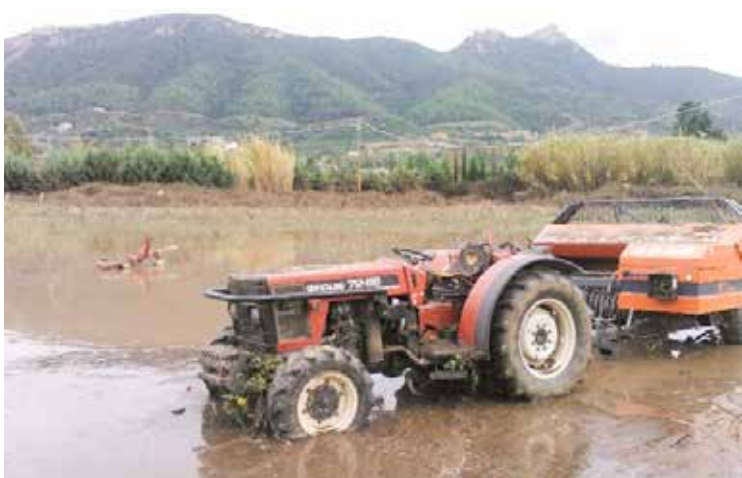
Campagne danneggiate dal maltempo