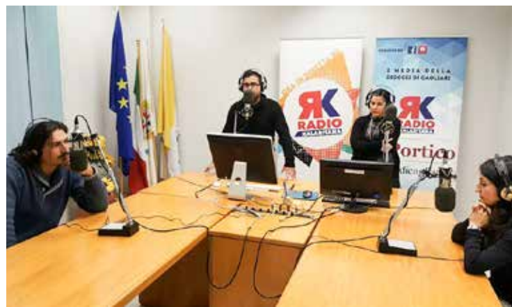
I protagonisti negli studi di Radio Kalaritana

La trama del film racconta gli ultimi giorni di vita di Gesù a partire da Betania, località della Giudea molto vicina a Gerusalemme, più volte citata nei Vangeli anche perché identificata quale luogo dove risiedeva Lazzaro. Per il regista «la particolarità consiste nella narrazione attraverso quattro diversi punti di vista. Il film esordisce con il capitolo di Pietro e prosegue facendo indossare allo spettatore le lenti di Giuda, della Madonna e del soldato romano Longino. La pellicola si conclude con la narrazione del calvario e della crocifissione. Da autore e regista mi colpisce particolarmente la figura di Longino, il quale, durante il film, si pone delle domande e dà un'in-