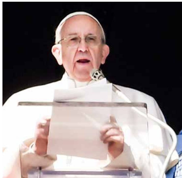
Francesco all'Angelus

All'Udienza generale papa Francesco si è soffermato sul tema della speranza nella storia biblica di Giuditta, della quale viene sottolineato il coraggio di agire in una situazione dove il nemico di Israele appariva invincibile. Fidarsi di Dio, ha spiegato il Santo Padre, «vuol dire entrare nei suoi disegni senza nulla pretendere, anche accettando che la sua salvezza e il suo aiuto giungano a noi in modo diverso dalle nostre aspettative». Sempre in settimana il Pontefice ha presieduto i secondi vesperi della solennità della Conversione di san Paolo apostolo, a conclusione