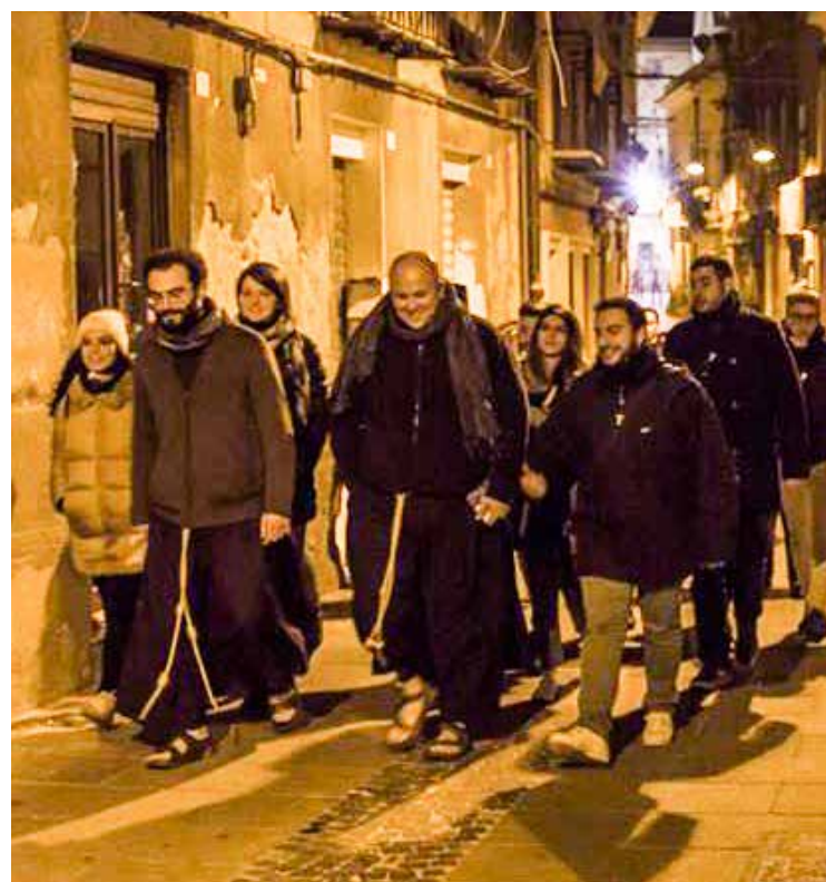
Giovani e frati per le strade di Cagliari

Ma perché un flash mob? Perché è esplosione di gioia, perché