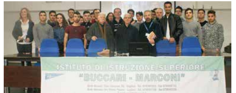
Il gruppo di studenti e reduci all'incontro nell'istituto Marconi