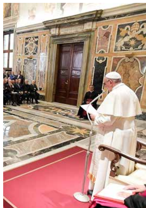
Il Papa riceve i giornalisti in Vaticano

Al riguardo infatti il Papa afferma: «Credo ci sia bisogno di spezzare il circolo vizioso dell'angoscia e arginare la spirale della paura, frutto dell'abitudine a fissare l'attenzione sulle «cattive notizie» (guerre, terrorismo, scandali e ogni tipo di fallimento nelle vicende umane). Certo, non si tratta di promuovere una disinformazione in cui sarebbe ignorato il dramma della sofferenza, né di scadere in