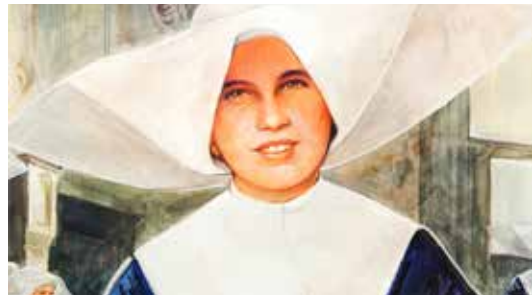
Suor Giuseppina Nicoli

Una serata per ricordare suor Giuseppina Nicoli attraverso la pubblicazione di un libro «Cagliari negli occhi e nel cuore. Il contesto in cui visse e operò la beata Giuseppina Nicoli, figlia della Carità», a cura di Anonimo