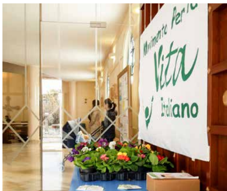
Uno stand del Centro di Aiuto alla Vita «Uno di noi»

Diverse le attività che vengono portate avanti nel Centro di aiuto alla Vita «Uno di noi». Ecco una breve scheda delle attività istituzionali del centro: interventi di aiuto alle mamme con progetti personalizzati che possono comprendere i colloqui in ospedale prima degli interventi programmati di interruzione volontaria di gravidanza, contributi economici mensili, con la fornitura di corredini, pannolini, latte in polvere, attrezzature per neonati. Sono previsti anche incontri motivazionali, colloqui con operatrici ed eventuale supporto psicoterapeutico. Il Centro realizza anche corsi preparto, grazie all'attività di formazione dei volontari con seminari di approfondimento delle tematiche relative alla difesa della vita. Sono simulati colloqui con le assistite e sono intraprese anche attività di divulgazione e intrattenimento come racconti di storie di mamme dove emerge l'esperienza di chi, da assistito, ha deciso di condividere la propria vicenda. Sono organizzati anche spettacoli di beneficenza musica, danza, cabaret, diffusi nei media e nei social network.