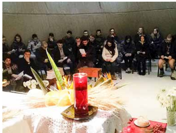
Un incontro a santo Stefano di Quartu