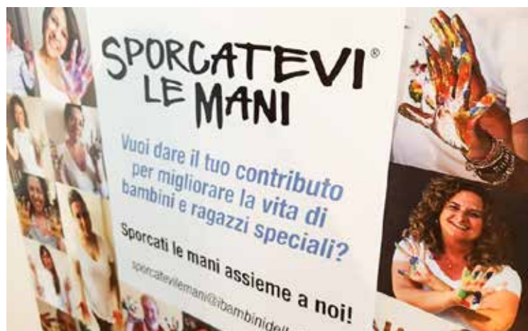
Il logo del progetto «Sporcatevi le mani»

muovere la generalizzazione delle competenze sociali nel contesto di vita dei ragazzi coinvolti. Per fare ciò è necessario lavorare in una logica di rete, coinvolgendo i terapisti di riferimento delle famiglie e facendo in modo che il piano di attività si armonizzi funzionalmente all'interno del percorso progettato per ciascun bambino, rafforzandone gli effetti nel tempo. Grazie alla pratica educativa e di aiuto della psicomotricità, sarà curata, in particolare modo, la relazione attraverso il corpo e il gioco spontaneo in modo da esaltare l'espressività, il protagonismo, i processi di apprendimento e l'uso di differenti modalità comunicative del bambino. Bambino considerato in modo globale come persona, integrando cioè la motricità e l'attività affettiva e cognitiva.