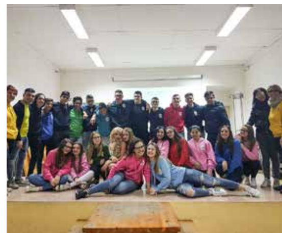
I giovani dell'oratorio di sant'Isidoro

La mattina di domenica scorsa alle 9.30 la processione col simulacro di san Giovanni Bosco è sfilato per