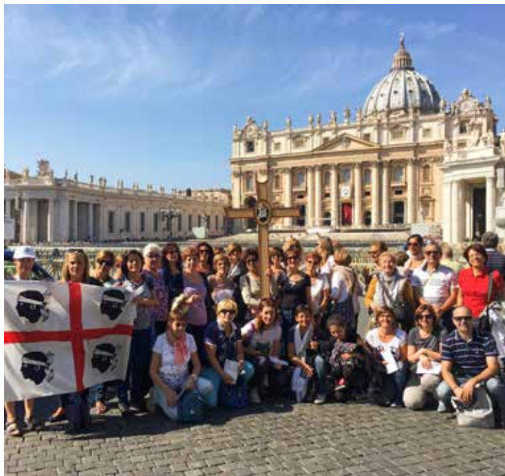
La delegazione diocesana a san Pietro

Al Giubileo hanno preso parte catechisti provenienti da diverse parrocchie della diocesi, da Sanluri, a Cagliari passando per Serrenti, Villasor, Decimoputzu, Settimo San Pietro, Ussana, Quartu Sant'Elena, Selargius e Monserr-