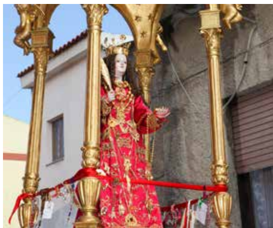
Il simulacro di santa Greca

In un primo tempo gli organizzatori, dopo aver consultato il parroco, avevano previsto un percorso diretto Villasor-Decimomannu poi, con la volontà di coinvolgere altre comunità, l'itinerario è stato allungato, per passare accanto alla chiesa di san Giorgio a Decimoputzu con relativa sosta, a Villaspeciosa e santa Maria di Uta, ultima sosta, prima di arrivare