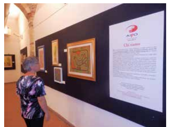
La mostra Aifo

Nel 2002, su richiesta del ministero della Salute pubblica del Paese africano, sono stati riallacciati rapporti di collaborazione, concretizzati in un nuovo accordo ufficiale.