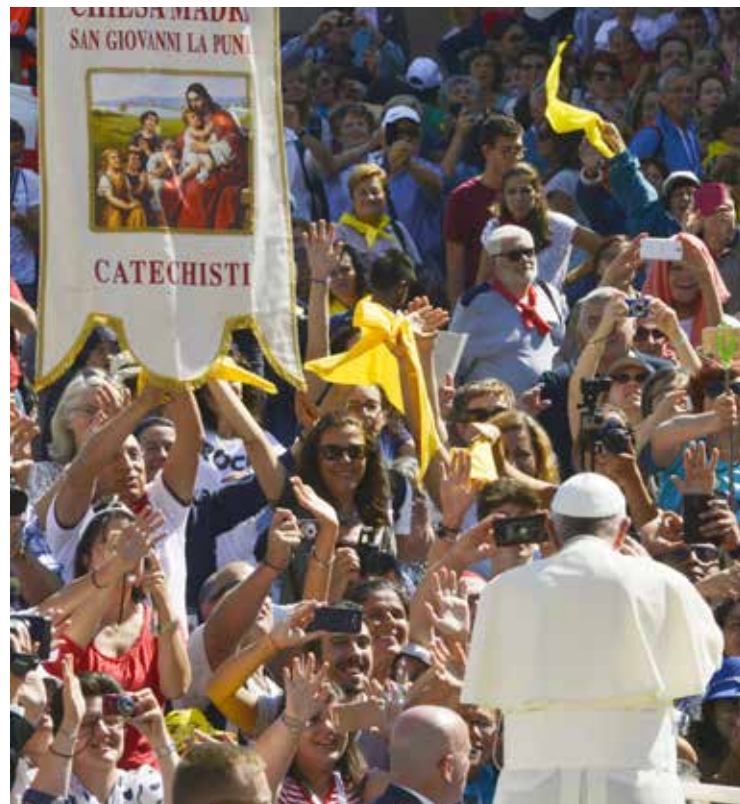
Francesco saluta i catechisti in piazza san Pietro

Nel suo discorso alla cerimonia conclusiva dell'incontro di Assisi, alla presenza dei rappresentanti delle diverse religioni, il Pontefice ha poi rivolto un appello per la pace che nasce dall'impegno delle varie religioni: «Noi non abbiamo armi. Crediamo però nella forza mite e umile della preghiera. In questa giornata, la sete di pace si è fatta invocazione a Dio, perché cessino guerre, terrorismo e violenze. [...] Cerchiamo in Dio, sorgente della comunione, l'acqua limpida della pace, di cui l'umanità è assetata: essa non può scaturire dai deserti dell'orgoglio e degli interessi di parte, dalle terre aride del guadagno a ogni costo e del commercio delle armi».