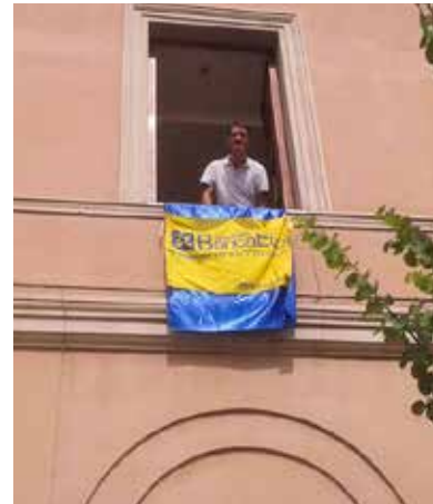
La finestra della nuova sede di Banca Etica