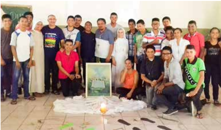
Gruppo del seminario di Viana

cesi dista 200 km dalla città più vicina e tutti i fine settimana, io e quattro seminaristi, dobbiamo trasferirci e i viaggi sono di solito di circa 300 km, ma possono arrivare anche fino a località distanti 600 km. Vale però la pena in quanto, in questo modo, si costruisce il futuro della Chiesa. Dico spesso ai preti locali di non preoccuparci oggi del fatto che non abbiamo preti o che siamo pochi e non riusciamo neanche a completare le 27 parrocchie che abbiamo. È necessario invece preoccuparsi per il futuro, lavorando oggi per dare impulso al seminario, soprattutto a livello di formazione vocazionale ma anche di manutenzione materiale del seminario stesso, dato che la situazione economica è disastrosa. Si rischia, insomma, di avere tante vocazioni ma di non poter accogliere i nuovi seminaristi perché non ci sono le risorse economiche, visto che le famiglie non hanno la possibilità di pagare. Il sostentamento dipende, quindi, quasi esclusivamente dalle parrocchie. Nell'ultima riunione del clero c'è stata una discussione anche su questo perché le parrocchie si attivino maggiormente ed aiutino il seminario. Anche perché il Brasile sta vivendo una forte crisi economica e la situazione è simile a quella dell'Italia di 5-6 anni fa e una situazione politica catastrofica. La presidente è stata deposta e non c'erano i motivi giuridici per farlo. C'è un presidente non frutto di legittimazione popolare e quindi la situazione in generale non è particolarmente buona.