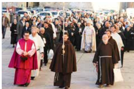
Religiosi in processione a Cagliari

La chiusura è previsto dopo le 17. Per informazioni è necessario rivolgersi alla delegazione Usmi e Cism, le due realtà associative che raggruppano le famiglie religiose maschili e femminili, presenti nelle dieci diocesi della Sardegna.