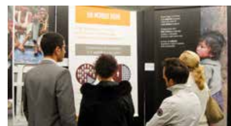
Uno dei pannelli espositivi della mostra