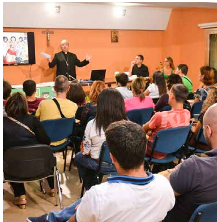
L'incontro di pastorale giovanile in Seminario

I referenti hanno quindi potuto esporre all'Ufficio di pastorale