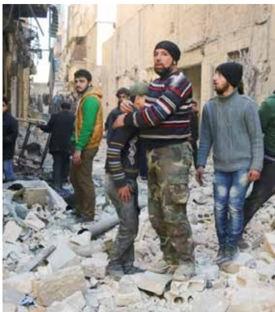
Le vittime della guerra

Un paese in guerra risulta poi poco appetibile per gli investitori, sono state chiuse aziende straniere, ambasciate, distrutte fabbriche e la gran parte della popolazione è rimasta senza un lavoro.