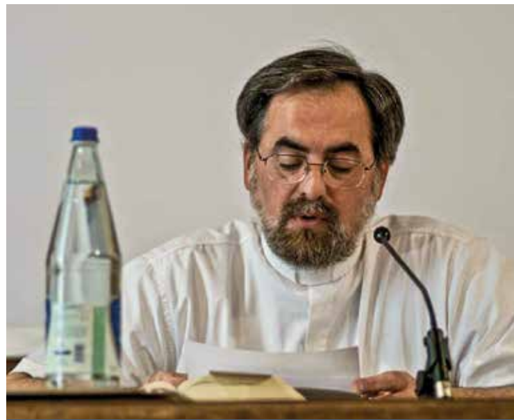
MONSIGNOR ROBERTO FORNACIARI

Nel Messaggio alla Diocesi, monsignor Fornaciari ha ringraziato il Papa per il nuovo incarico, «accolto con timore - scrive - e trepidazione... non vi conosco e voi non conoscete me. Ci accomuna lo stupore per questo incontro inedito e inaspettato». «Ci conosceremo e potremo scoprire di essere tutti insieme il popolo di