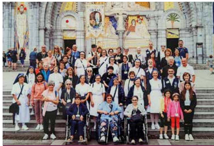
IL GRUPPO DEI PARTECIPANTI

Un pomeriggio in visita al Santuario di Nostra Signora di Bétharram, alla scoperta di un piccolo gioiello ricco di opere d'arte, sito nel