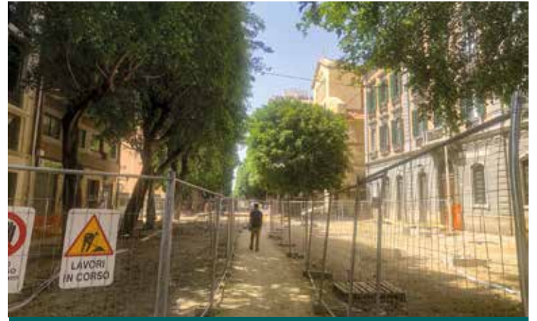
IL CANTIERE DI VIALE TRIESTE

Domenica, memoria liturgia della Beata Vergine del Monte Carmelo le Messe alle 8, alle 9, alle 10, alle 11 e alle 12 la supplica. Nel pomeriggio alle 18.30 la solenne concelebrazione eucaristi-