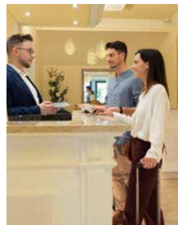
LA RECEPTION DI UN HOTEL

Ci sono imprenditori del settore turistico che hanno reclutato personale dalla penisola, perché in Sardegna non sono riusciti a trovarne di specializzato. Altri che invece parlano dell'inspiegabile licenziamento di chi, giunto in struttura per lavorare, è andato via dopo alcuni giorni, avendo scoperto che gli alloggi non avevano bagno in camera, ma in comune, e che gli alloggi erano sistemati nei piani interrati. «Evidentemente - racconta un maître di un hotel della costa di Pula - il bisogno di lavorare non era così impellente, visto che hanno rinunciato a 1700 euro di paga base, cifra alla quale vanno sommate le mance e l'importo sarebbe potuto salire di molto». Per contro però ci sono diversi casi nei quali i contratti hanno clausole capestro e gli addetti, molto spesso giovanissimi, devono accettare condizioni non proprio limpide. Per questo la CGIL ha avviato