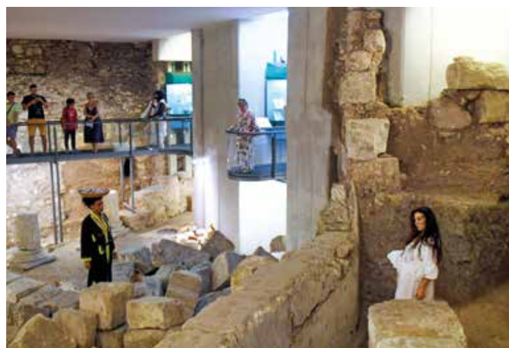
UNA DELLE ATTIVITÀ A SANT'EULALIA

Il percorso portato avanti in questi mesi aveva come obiettivo quello di mettere in mostra le abi-