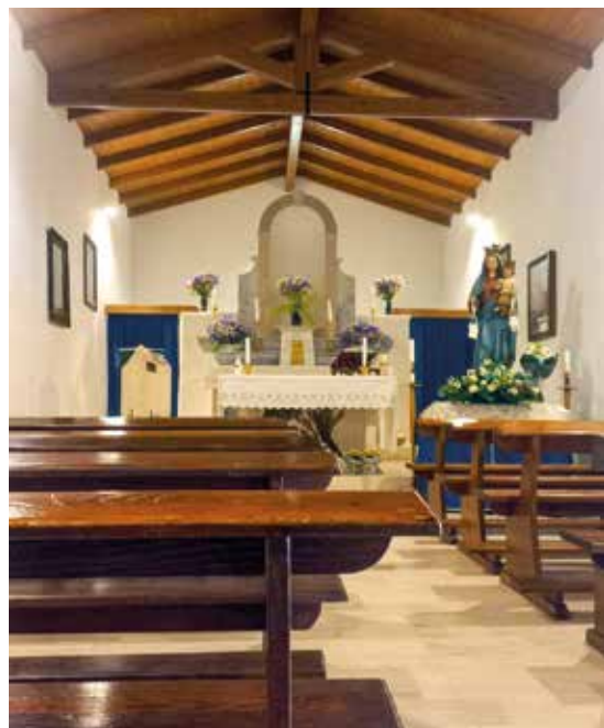
L'INTERNO DELLA CHIESA

Seri problemi strutturali nel 2018 hanno determinato la chiusura della chiesetta, con grande dispiacere della comunità molto legata a questa devozione, ed è subito iniziata una raccolta di fondi per finanziare il restauro. I lavori a causa di alcuni imprevisti hanno subito vari ritardi, con il Covid che ha allungato i tempi per le autorizzazioni di legge e, all'apertura del cantiere, la scoperta che i lavori preventivati non avrebbero permesso la riapertura della chiesetta, in quanto i danni alla copertura ne rendevano impossibile il recupero. Si è dovuto quindi procedere a progettare la sostituzione integrale della copertura in calcestruzzo di una cinquantina di anni fa con una in legno (peraltro più aderente alla storia dell'edificio), con conseguente aumento notevole dei costi: dai 30 mila euro preventivati precedentemente (e disponibili) si è arrivati, grazie peraltro a sconti da parte delle imprese e dei fornitori, a una cifra prossima agli 80 mila euro. Il Comune ha coperto, con un intervento da 40.000 euro, gran parte del necessario ed è contemporaneamente ripresa la raccolta di fondi tra i privati e le aziende del territorio, che hanno risposto generosamente permettendo di arrivare a chiudere il cantiere nel mese di giugno e riaprire la chiesa giovedì 6 luglio, in tempo per iniziare la novena del Carmine nella sua chiesetta il giorno successivo. Giovedì il simulacro della Madonna del Carmine è stato riportato dalla chiesa parrocchiale,