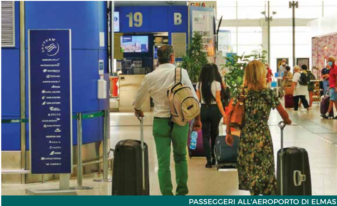
PASSEGGERI ALL'AEROPORTO DI ELMAS