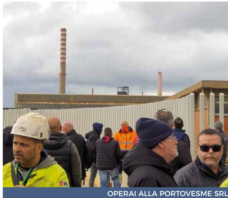
OPERAI ALLA PORTOVESME SRL