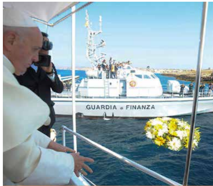
IL PAPA A LAMPEDUSA NEL 2013

Tutti quanti, ha sottolineato il Pontefice nella sua Lettera, «siamo chiamati ad un rinnovato e profondo senso di responsabilità, dando prova di solidarietà e di condivisione». La Chiesa, se vuole essere «realmente profetica», deve adoperarsi «con sollecitudine per porsi sulle rotte dei dimenticati, uscendo da sé stessa, lenendo con il balsamo della fraternità e della carità le piaghe