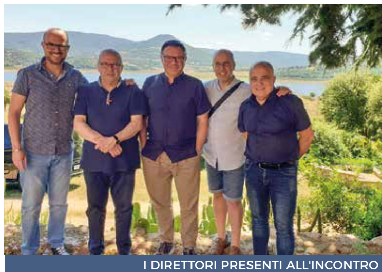
I DIRETTORI PRESENTI ALL'INCONTRO

S inodalità e sostenibilità, sono state queste le parole chiave della riunione dei direttori dei periodici diocesani della Sardegna che si sono ritrovati a Pattada lo scorso mercoledì, ospiti della «Voce del Logudoro», il settimanale della diocesi di Ozieri