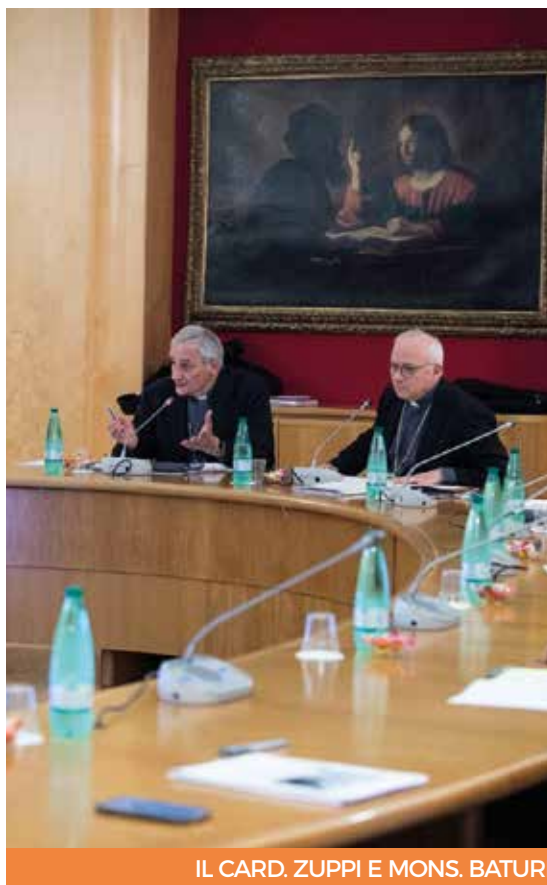
IL CARD. ZUPPI E MONS. BATURINA

Dopo i primi due anni di ascolto narrativo, che hanno coinvolto centinaia di migliaia di fedeli in tutta Italia, il Cammino dovrà ora proseguire con la fase dedicata alla lettura spirituale delle narrazioni emerse per poi culminare in quella profetica (2024-2025). In quest'ottica, il tempo del discernimento aiuterà a individuare quali dinamiche ecclesiali devono essere modificate per promuovere la mis-