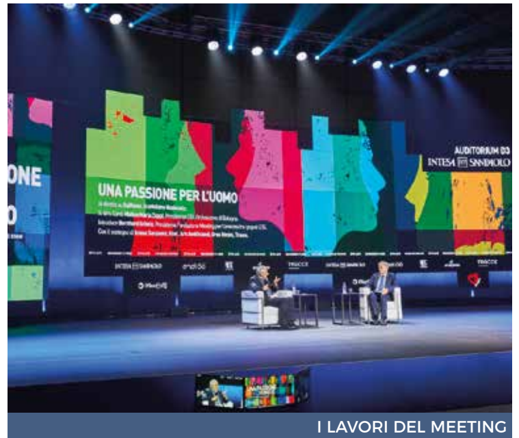
I LAVORI DEL MEETING

Forti invece le parole del Patriarca latino di Gerusalemme, Pierbattista Pizzaballa, in merito alla recrudescenza delle tensioni tra israeliani e palestinesi.