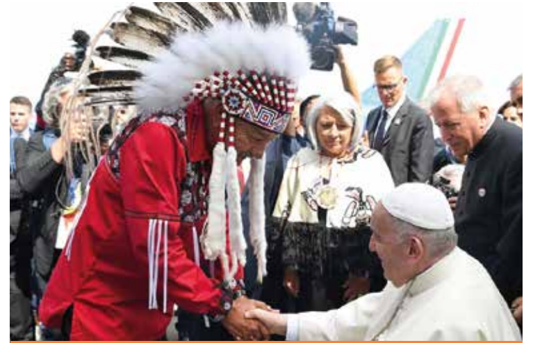
IL PAPA INCONTRA I NATIVI DEL NORD AMERICA

La seconda sfida è sulla testimonianza. Per evangelizzare «bisogna anche essere credibili». Il