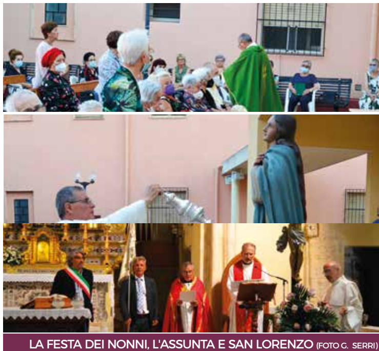
LA FESTA DEI NONNI, L'ASSUNTA E SAN LORENZO