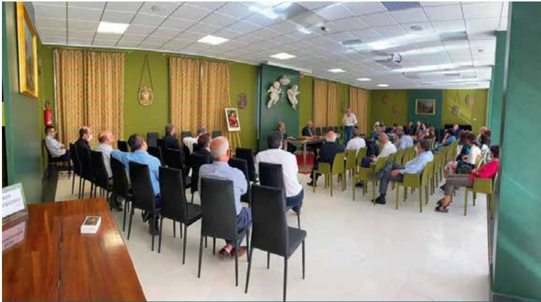
UN INCONTRO DI PASTORALE SOCIALE E DEL LAVORO