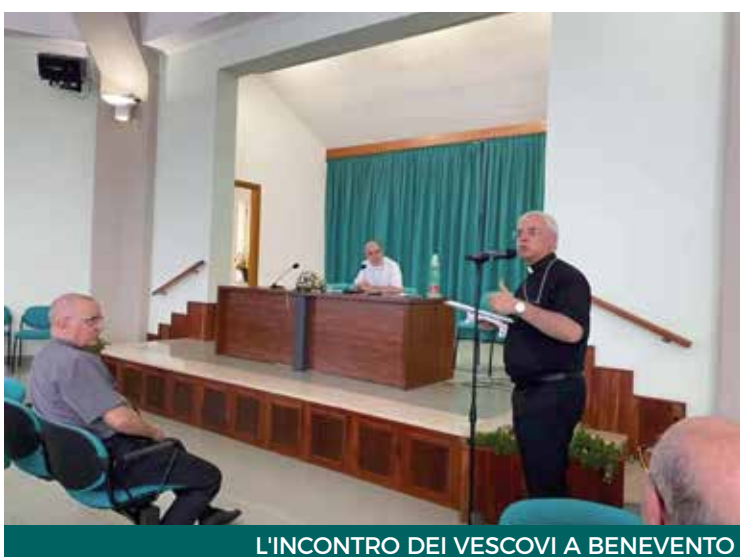
L'INCONTRO DEI VESCOVI A BENEVENTO