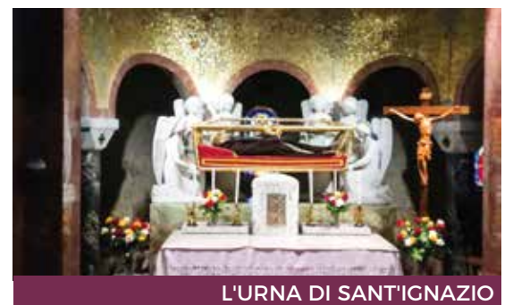
L'URNA DI SANT'IGNAZIO