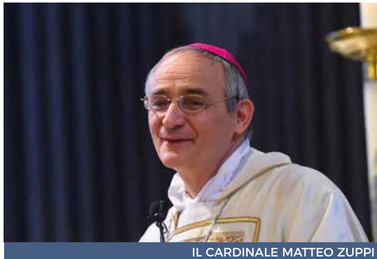
IL CARDINALE MATTEO ZUPPI