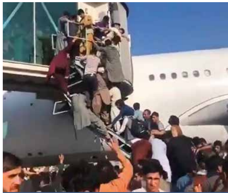
IN FUGA DA KABUL

È solo uno degli esempi. Ciò che però emerge dall'analisi di Piro, con dati e citazioni puntuali, è che gli Stati Uniti e gli alleati hanno agito in modo da favorire il rientro dei talebani, cacciati via dal Paese e confinati in una regione a ridosso del Pakistan,