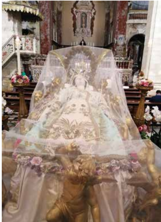
LA VERGINE DORMIENTE