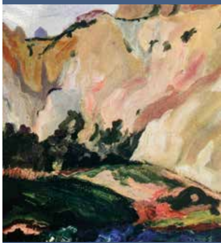
UN PAESAGGIO A OLIO DI CARLO LEVI - 1936