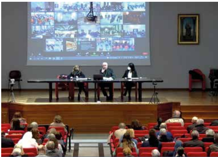
ASSEMBLEA SINODALE IN SEMINARIO

Online sui siti https://camminosinodale.chiesacattolica.it e https://www.chiesacattolica.it la Sintesi nazionale della fase diocesana del Sinodo 2021-2023 «Per una Chiesa sinodale: Comunione, partecipazione e missione» che la Presidenza della Cei ha consegnato lo scorso 15 agosto alla Segreteria generale del Sinodo dei vescovi. Il Sinodo è inteso come un processo sinodale e culminerà nel 2023 con la fase universale, preceduta da quella continentale.