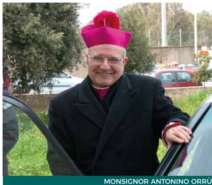
MONSIGNOR ANTONINO ORRÙ

Uomo di ascolto e dialogo monsignor Orrù ha testimoniato la prossimità della Chiesa alle persone, specie i più deboli, gli ulti-