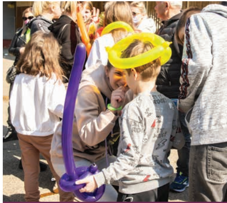
L'ARRIVO DEI PROFUGHI UCRAINI