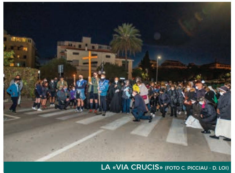
LA «VIA CRUCIS»

zioni, preparate e pregate dalle parrocchie della città di Cagliari, ha colpito in particolar modo l'undicesima stazione (Gesù è inchiodato in croce) letta da una giovane ucraina: «Non si comprende il perché di così tanta crudeltà dell'uomo, da spingersi oltre pur di mantenere alta la propria supremazia, il proprio potere. Chiedo schiaccia chiodo, carne schiaccia carne. Cosa c'entri tu, ferro, con il corpo caldo e vivo di un uomo, che sa abbracciare, senza far male, sanguina se ferito, cresce quando si sacrifica? Ancora si conficcano chiodi sui palmi inermi dell'umanità che non voleva altro che la vita. Ma sotto i