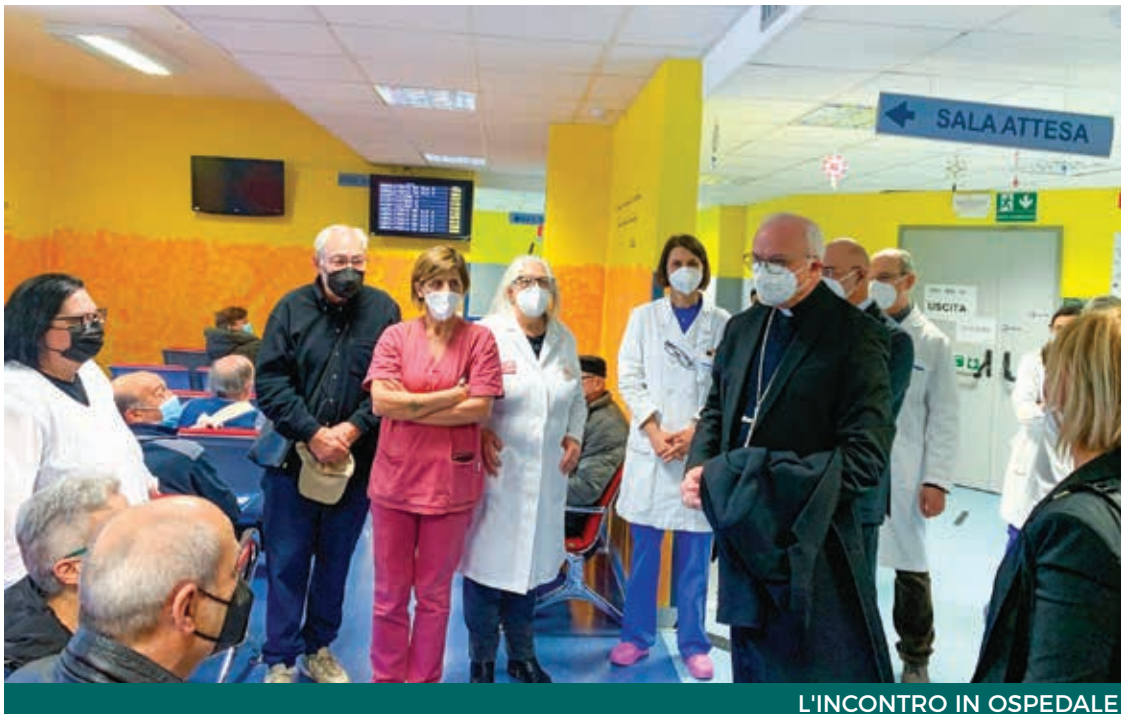
L'INCONTRO IN OSPEDALE