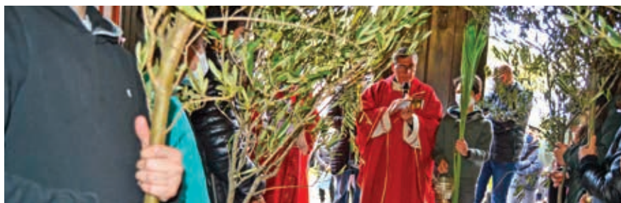
LA CELEBRAZIONE DELLE PALME

Domenica delle Palme: inizia la Settimana Santa, il cuore della fede cristiana. Nella parrocchia del SS. Redentore di Monserrato abbiamo iniziato con gioia l'ingresso di Gesù a Gerusalemme, con l'Osanna al Figlio di Davide e con rami di ulivo e di palma.