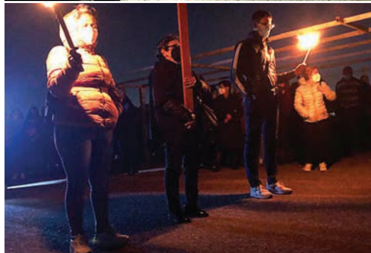
LA «VIA CRUCIS» A QUARTUCCIU