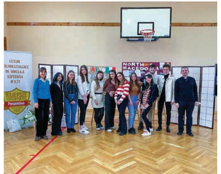
IL GRUPPO DEL «DETTORI» CON GLI STUDENTI POLACCHI