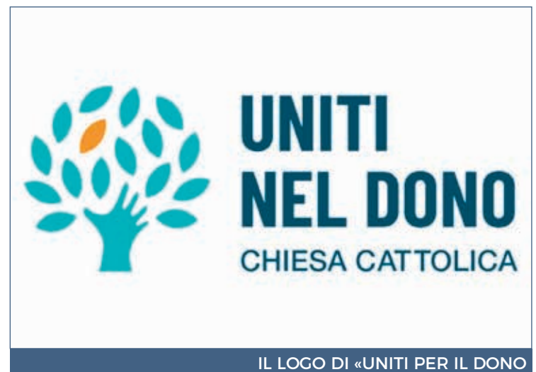
IL LOGO DI «UNITI PER IL DONO»

mazione e creare disorientamento. Più volte ribadito che, anche in questi anni di pandemia, e perciò di difficoltà per molte famiglie, la Chiesa, grazie ai fondi Ottopermille, ha rappresentato un punto di riferimento e un sostegno efficace, grazie alle Caritas diocesane, e ai numerosi cantieri aperti in tutta l'Isola, per restauro di beni culturali ed edilizia di culto, che hanno dato e danno, ossigeno ad una economia del settore edilizio e alle famiglie che vi lavorano. Il progetto «Uniti nel dono», che partirà a breve, sarà una preziosa opportunità per ribadire l'impegno, la presenza fattiva della chiesa nel territorio, e per cercare di arginare una pericolosa deriva, alimentata anche da una campagna denigratoria su come le risorse vengono utilizzate. La trasparenza che da alcuni anni caratterizza una rendicontazione