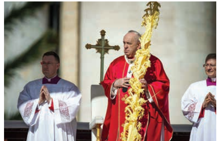
LA MESSA DELLA DOMENICA DELLE PALME

Papa Francesco ha posto in luce il motivo per cui Gesù chiede il perdono dei suoi crocifissori: «Non sanno quello che fanno». Egli «si fa nostro avvocato» e ricorda «quell'ignoranza del cuore che abbiamo tutti noi peccatori. Quando si usa violenza non si sa più nulla su Dio, che è Padre, e nemmeno sugli altri, che sono fratelli. Si dimentica perché si sta al mondo e si arriva a com-