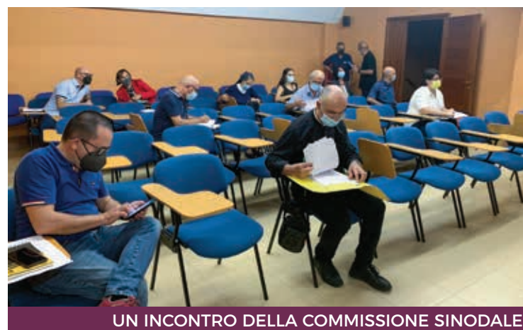
UN INCONTRO DELLA COMMISSIONE SINODALE