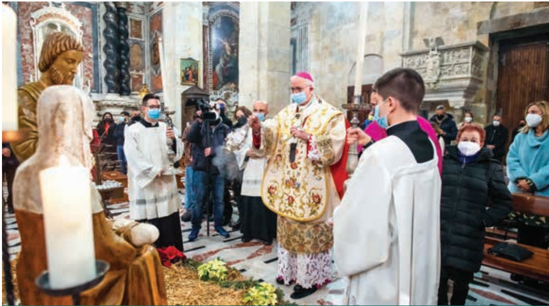
LA BENEDIZIONE DEL PRESEPE