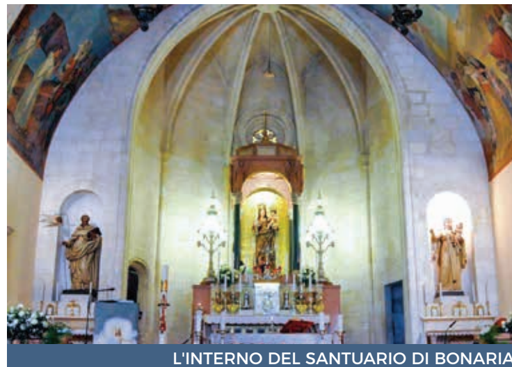
L'INTERNO DEL SANTUARIO DI BONARIA