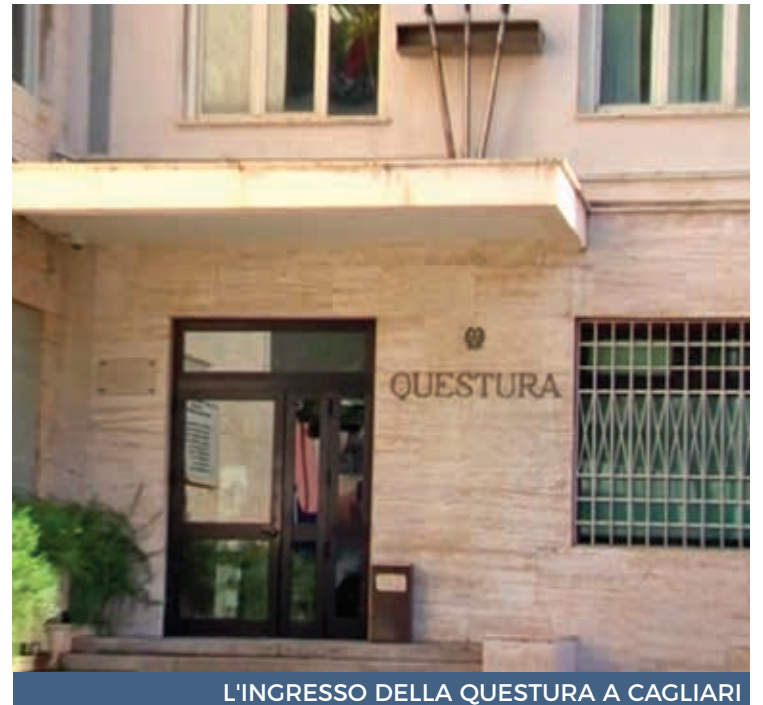
L'INGRESSO DELLA QUESTURA A CAGLIARI

Sul delicato impegno del contrasto alla violenza di genere gli investigatori della Questura si sono occupati di ben 117 episodi di