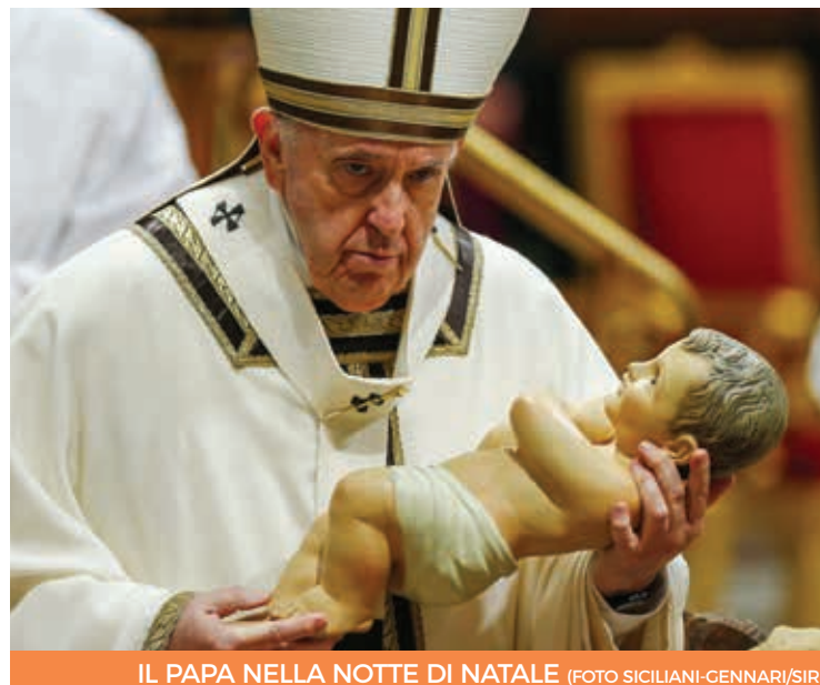
IL PAPA NELLA NOTTE DI NATALE

Il secondo aspetto è quello del «meditare»: «Il verbo impiegato dal Vangelo evoca l'intreccio tra le cose: Maria mette a confronto esperienze diverse, trovando i fili nascosti che le legano. [...] Nel suo cuore di madre comprende che la gloria