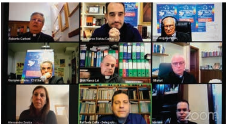
LA DIRETTA WEB

Erano collegati in 600 circa lo scorso 29 dicembre per la XXXV Marcia della Pace, bloccata ancora una volta per il Covid.