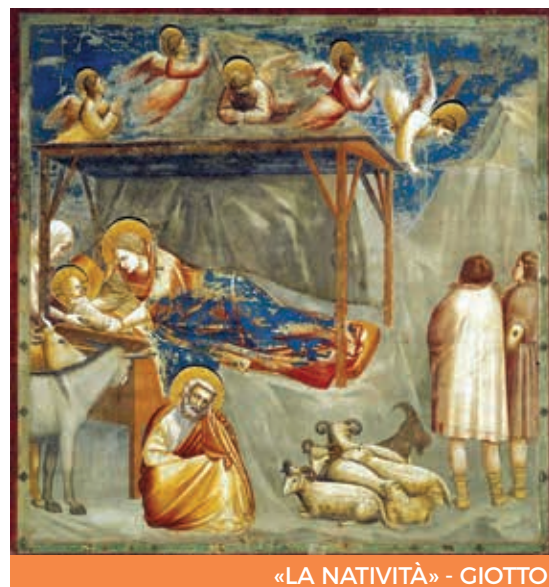
«LA NATIVITÀ» - GIOTTO