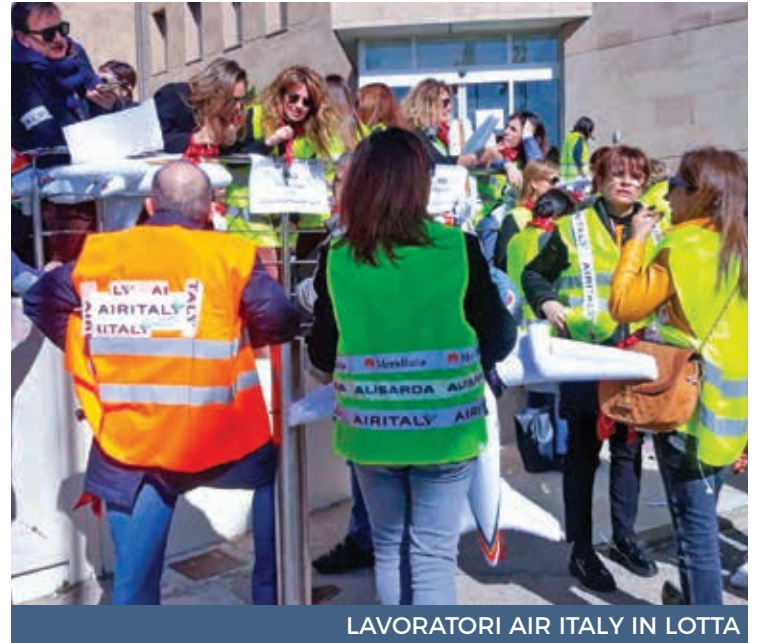
LAVORATORI AIR ITALY IN LOTTA

C'è poi la spada di Damocle della centrale Enel «Grazia Deledda», sempre a Portovesme, il cui futu-