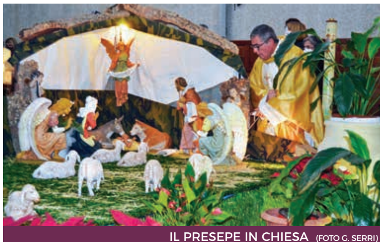
IL PRESEPE IN CHIESA