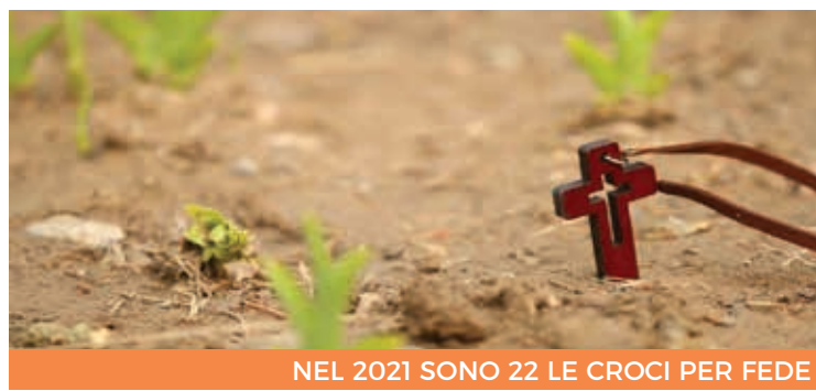
NEL 2021 SONO 22 LE CROCI PER FEDE

N el 2021 sono stati uccisi nel mondo 22 missionari. Lo riferisce il consueto dossier diffuso a fine anno dall'agenzia Fides. Si tratta di 13 sacerdoti, un religioso, 2 religiose, 6 laici. «Riguardo alla ripartizione continentale, il numero più elevato si registra in Africa, dove sono stati uccisi 11 misio-