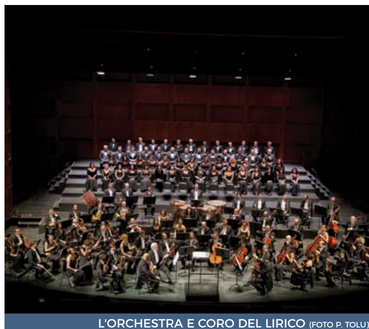
L'ORCHESTRA E CORO DEL LIRICO

I titoli delle sei opere, oltre a «Cecilia», sono «L'elisir d'amore» di Gaetano Donizetti, in programma dal 4 al 12 marzo, «Ernani» di Giuseppe Verdi dal 9 al 16 aprile, «La sonnambula» di Vincenzo Bellini dal 13 al 21 maggio, «Manon Lescaut» di Giacomo Puccini dal 7 al 15 ottobre, «West Side Story» di Leonard Bernstein dal 15 al 23 dicembre. Per il balletto il classico «Romeo e Giulietta» di Sergei Prokof'ev, in programma dall'11 al 19 novembre. Non mancheranno gli interventi di autorevoli studiosi e musicologi, con l'ausilio del pianoforte, ascolti registrati, proiezioni video e letture dal vivo, che presenteranno le opere liriche ed il balletto in cartellone in sette incontri con il pubblico, ad ingresso libero, che si svolgono,