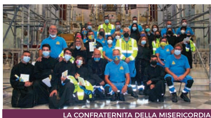
LA CONFRATERNITA DELLA MISERICORDIA

scuole popolari di fede vissuta e fucine di santità; potranno proseguire ad essere nella società "fermento" e "lievito" evangelico a contribuire a suscitare quel risveglio spirituale che tutti auspichiamo". Vasto è dunque il campo nel quale dovete lavorare, cari amici, ed io vi incoraggio a moltiplicare le iniziative ed attività di ogni vostra Confraternita. Vi chiedo soprattutto di curare la vostra formazione spirituale e di tendere alla santità, seguendo gli esempi di autentica perfezione cristiana, che non mancano nella storia delle vostre Confraternite. Non pochi vostri confratelli, con coraggio e grande fede, si sono contraddistinti, nel corso dei