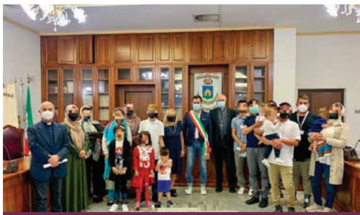
LE FAMIGLIE AFGANE IN MUNICIPIO A QUARTUCCIU

Una casa, un lavoro, ricostruire la propria vita in Italia e chissà un giorno, se sarà possibile, ritornare nel loro Paese. Nei volti e nelle parole delle famiglie afgane accolte dalla Caritas diocesana emergono la voglia di ricominciare ma anche le preoccupazioni per ciò che si è lasciato. Foza (nome di fantasia) è sbarcato a Cagliari per raggiungere sua mo-