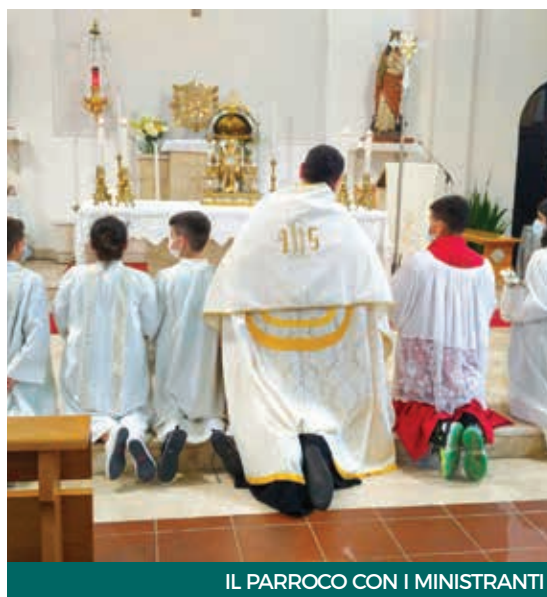
IL PARROCO CON I MINISTRANTI

Siamo cresciuti con il Meg e pane e oratorio, che ci hanno permesso di viaggiare e incontrare tante parrocchie di tutta Italia. Queste esperienze ci hanno trasmesso dei grandi valori, che cerchiamo di insegnare ai nostri bambini e ragazzi. Non ho mai pensato di cambiare parrocchia o di sceglierne una