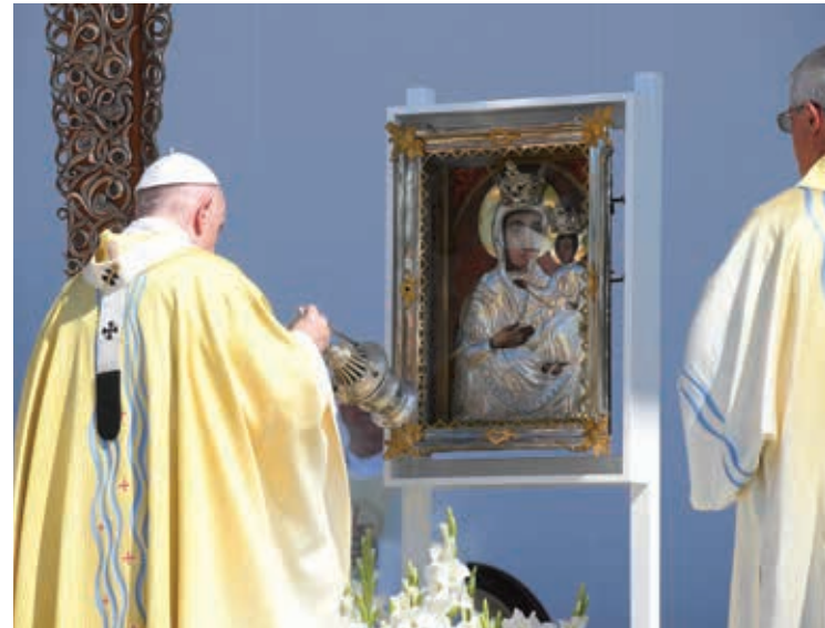
LA MESSA NELLA PIAZZA DEGLI EROI A BUDAPEST

San Paolo, ha messo in evidenza il Pontefice, «insiste con quei cristiani perché non dimentichino la novità della rivelazione di Dio che è stata loro annunciata». La fede in Gesù Cristo «ci ha permesso di diventare realmente figli di Dio e anche suoi eredi». Per i cristiani è indispensabile «fare memoria grata» del momento in cui sono diventati figli di Dio, «quello del nostro battesimo, per vivere con