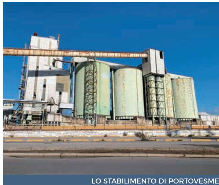
LO STABILIMENTO DI PORTOVESME

I quali, da parte loro, hanno anche ribadito la necessità di integrare la mobilità di 450 euro e di comprendere tutti i lavoratori rimasti ancora fuori. È proprio l'azienda che ha fretta di ripartire avendo già concordato con Enel un contratto di fornitura di energia, al momento bloccato, con una fidejussione di 45 milioni, contratto sul quale pende una spada di