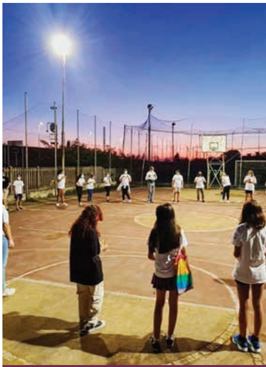
ATTIVITÀ IN ORATORIO

Le fiabe poi dicono sempre una profondissima verità: sono specchio del nostro mondo interiore e spesso portano a galla alcuni snodi essenziali della nostra vita interiore. Ma sono anche oneste in quanto trattano temi importanti come la paura, la violenza, la morte e l'invidia. In esse il male è molto presente e non è privo delle sue attrattive, tanto che a volte sembra vincere su ciò che è bello e buono. Per questo prendono molto sul serio le ansie esistenziali e le paure, dei piccoli come dei grandi, facendo percorrere fondamentalmente un viaggio, non solo «geografico» ma soprattutto esistenziale: l'eroe delle fiabe arriva alla fine della fiaba sem-