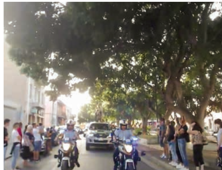
IL PASSAGGIO DEL SIMULACRO PER LE STRADE