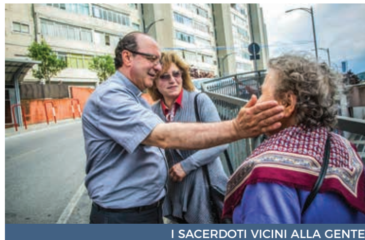
I SACERDOTI VICINI ALLA GENTE