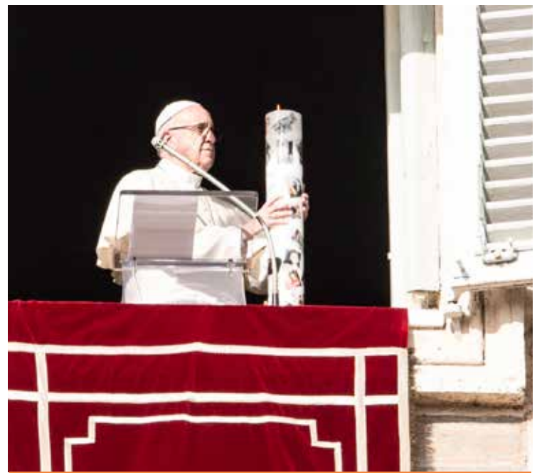
FRANCESCO ACCENDE IL CEREO PER LA SIRIA

Ricevendo in udienza i partecipanti alla conferenza internazionale su droga e dipendenze, promossa dal