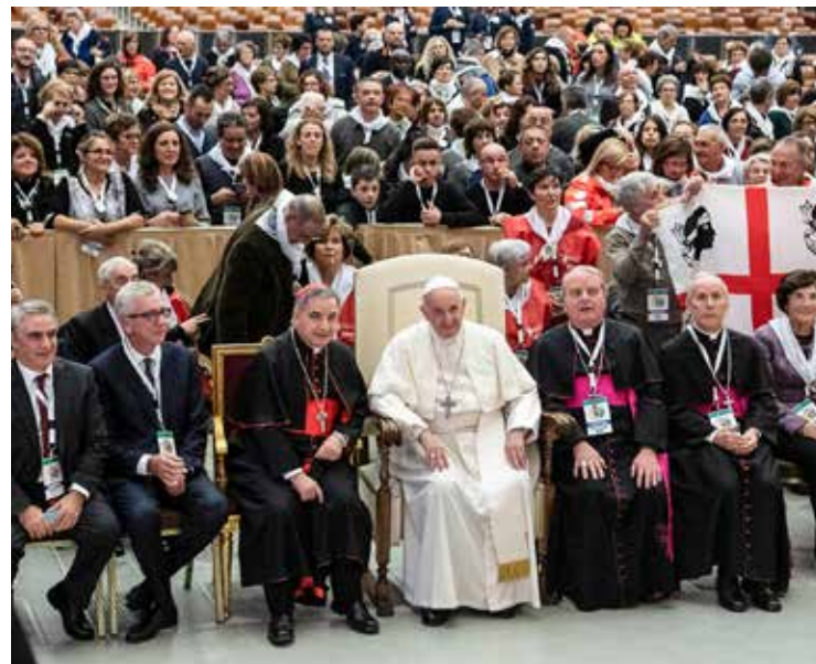
LA DELEGAZIONE SARDA CON IL PAPA