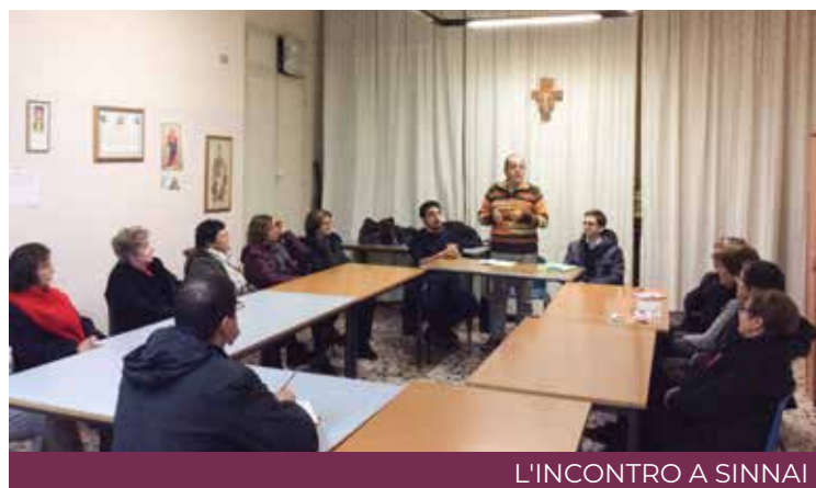
L'INCONTRO A SINNAI

Prima trasferta della pastorale sociale e del lavoro «itinerante».