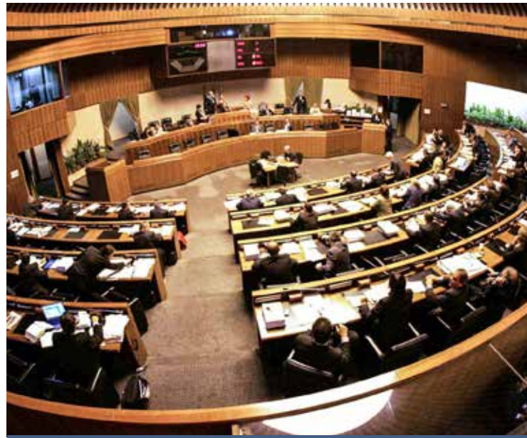
L'AULA DEL CONSIGLIO REGIONALE

Ancora il mutuo da 700 milioni approvato dall'Aula, appaltato quasi per il 40%. Il presidente del parlamentino ha ricordato poi i 45 milioni stanziati per il reddito di inclusione sociale (l'80% già trasferito ai Comuni), l'intervento per l'Università con 9727 borse di studio (da poco più di 4000) erogate grazie al provvedimento approvato dall'Aula per incrementare il numero. «Questo - ha detto - significa intervenire in modo efficace sul contenimento dei "Neet", cioè sul numero dei giovani, circa 81mila nell'Isola, che non lavorano e non cercano un'occupazione. In questi anni siamo riusciti ad ottenere l'incremento dei fondi Miur a favore delle università sarde passati dai 4 milioni del 2014 agli 11 del 2018. Abbiamo inoltre alzato la soglia Isee per le borse di studio da 17mila a 23mila euro. Nel 2014 solo la metà delle domande veniva soddisfatta. Oggi, tutte le 9727 richieste sono andate a buon fine, un risultato eccezionale che consentirà di ridurre drasticamente l'abbandono degli studi universitari». Concludendo Sabatini, ha voluto