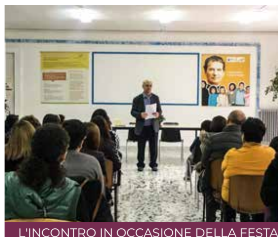
L'INCONTRO IN OCCASIONE DELLA FESTA