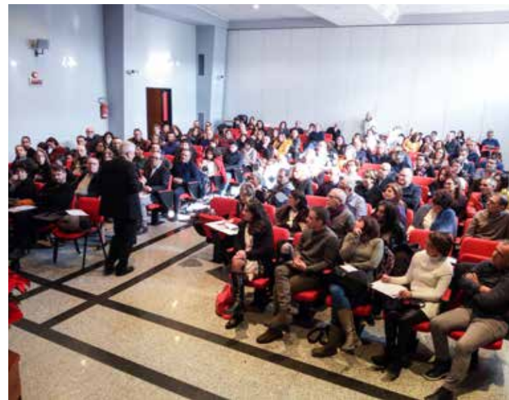
LE FAMIGLIE PRESENTI AL CONVEGNO DIOCESANO

Ha ricordato che l'essere cristiani per noi ha un significato molto importante, perché non siamo soli, Gesù è con noi, non dobbiamo scoraggiarci se nella nostra vita di coppia ci sono ancora molte cose da migliorare; se nell'educazione dei nostri figli abbiamo fatto e facciamo tanti errori, come l'essere troppo protettivi, invadenti, talvolta oppressivi o imprigionandoli in un affetto che spesso non è amore. Aceti ci ha dato alcuni consigli per trasformare tutto questo in amore vero. Senza pretendere o illuderci che corsi di formazione