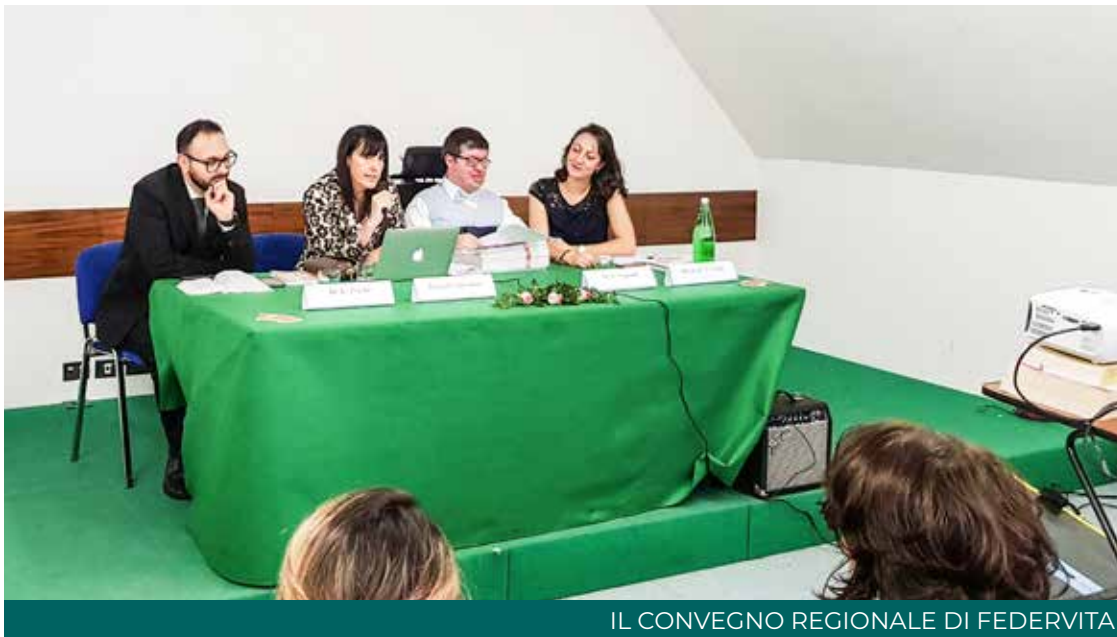
IL CONVEGNO REGIONALE DI FEDERVITA