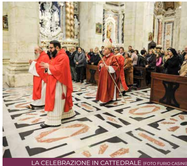
LA CELEBRAZIONE IN CATTEDRALE

Per questo quel santuario ha 400 anni ma è sempre giovane, perché ispira e rafforza testimoni nuovi, di oggi e di ieri, a gridare al mondo la verità del Vangelo. L'arcivescovo Arrigo Miglio, nella Messa che è seguita alla processione, ha ricordato proprio questo: i martiri di ieri e i martiri di oggi raccontano con una forza straordinaria, la verità del Vangelo, contro ogni altro modo di