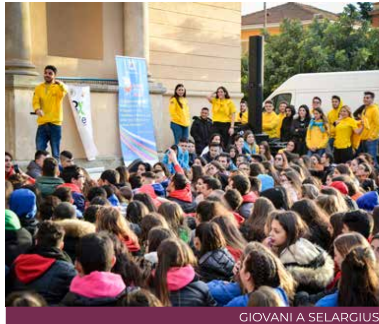
GIOVANI A SELARGIUS