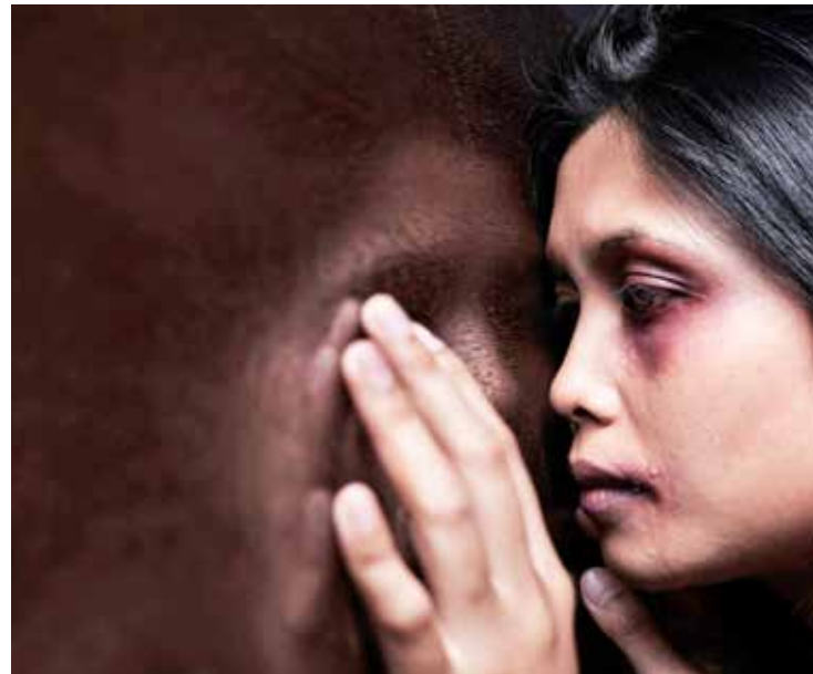
UNA DONNA VITTIMA DI VIOLENZA

A Cagliari sono state distribuite shopper e brochure informative realizzate da «Cittadinanza-attiva» con il contributo dell'azienda sanitaria di Cagliari: una map-