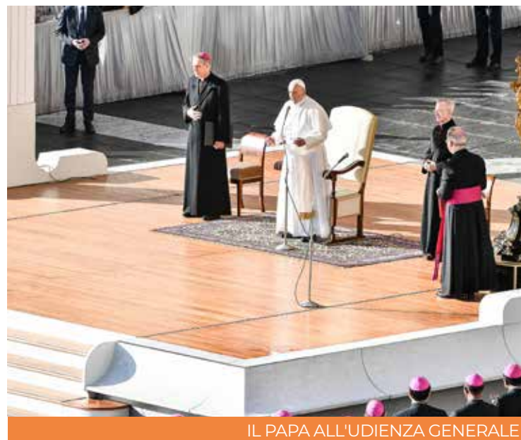
IL PAPA ALL'UDIENZA GENERALE

Durante la settimana il Pontefice, attraverso un videomessaggio, si è rivolto ai partecipanti al Festival della Dottrina Sociale della Chiesa, che si è svolto a Verona. Parlando del tema del Festival, «Il rischio della libertà», papa Francesco ha denunciato tre situazioni che per tante persone limitano la possibi-