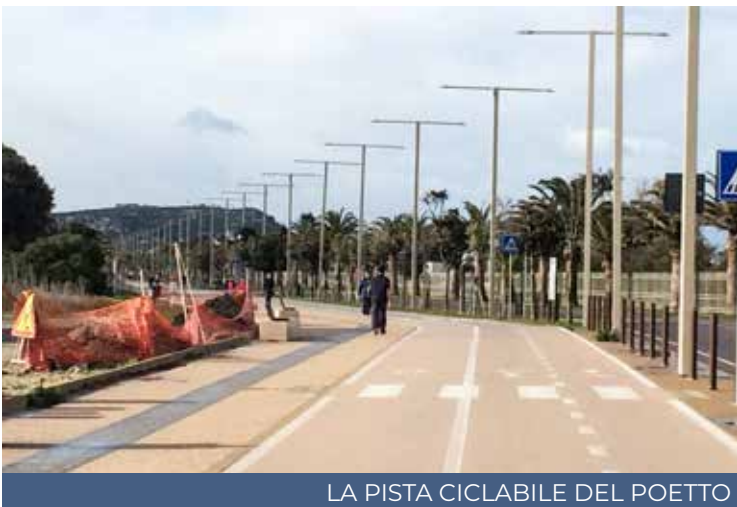
LA PISTA CICLABILE DEL POETTO

U n progetto per valorizzare i percorsi ciclabili a partire dall'alternanza scuola lavoro. Nella sala Ex Cappella della Provincia di Cagliari in via