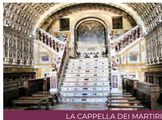
LA CAPPELLA DEI MARTIRI