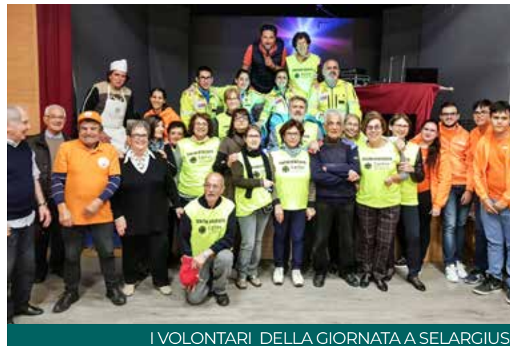
I VOLONTARI DELLA GIORNATA A SELARGIUS

to Caritas inter-parrocchiale, dei rappresentanti le organizzazioni di volontariato, la rappresentante della Caritas diocesana, che hanno messo in evidenza il loro impegno di servizio, in un territorio che soffre il dramma della povertà, della mancanza di lavoro, capace di togliere dignità a chi è disoccupato, a chi è schiavo delle dipendenze, che impoveriscono la vita di chi ne è vittima, dei separati e dei divorziati, dei senza casa, dei nomadi e dei migranti e di tutte quelle persone afflitte da mille povertà e solitudini. Nell'intermezzo anche un bel canto del poeta e cantautore Antonello Nuvole, che ha sintonizzato le menti sulla fame del mondo: «Mondo lontano e mondo vicino e interiore». Padre Stefano Messina, a nome dei tre parroci, ci ha ricordato che testimoniare Cristo significa avvicinar-