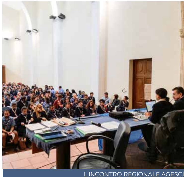
L'INCONTRO REGIONALE AGESCI