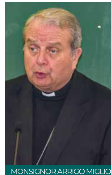
MONSIGNOR ARRIGO MIGLIO

In particolare, nell'analisi dell'enciclica, monsignor Miglio sottolinea che «la carità deve essere riscattata». Ossia, la carità non deve essere intesa unicamente come forma di assistenzialismo ma, al contrario, deve declinarsi come un fondamentale criterio attorno al quale regolare la vita sociale della comunità. Una luce che orienta, quindi, la ricerca del bene comune. Se intesa in questo senso allora la carità può divenire per davvero la stella polare che consente di dare dignità ad ogni persona. Per tutto ciò, secondo l'Arcivescovo, questo evento rappresen-