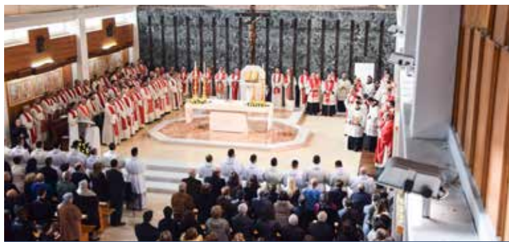
LA CELEBRAZIONE NELLA CAPPELLA DEL SEMINARIO

«Il migliore annuncio è la testimonianza». È uno dei passaggi dell'omelia pronunciata da monsignor Ignazio Sanna, arcivescovo di Oristano, nel corso della celebrazione eucaristica nella Cappella del Seminario arcivescovile di Cagliari, affollato di parenti e amici dei nove lettori e dei sette accoliti. Presenti alla