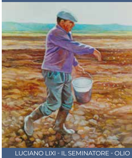
LUCIANO LIXI - IL SEMINATORE - OLIO

L'esame della complessa opera di Luciano Lixi disegnatore, pittore e muralista, aiuta a chiarire l'unicità di questo geniale artista interprete di una modernità fondata sulla tradizione. È, senza dubbio, questa la solida base su cui poggia tutta la storia pittorica di un artista dalle potenti capacità espressive.