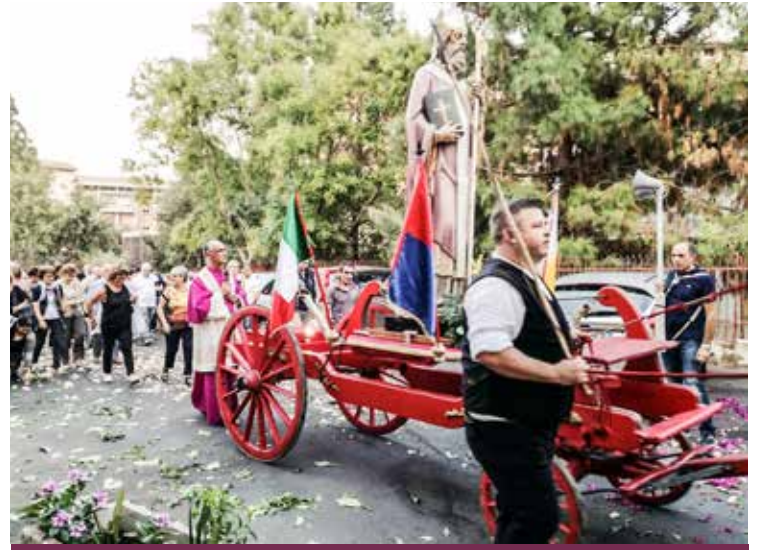
LA PROCESSIONE DI SANT'EUSEBIO