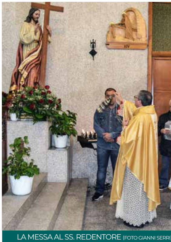
LA MESSA AL SS. REDENTORE

e in ogni bisogno». «Nel Regno di Dio - ha concluso il parroco - non si combatte, non si fa a gara a chi arriva primo, non c'è posto per chi vuole comandare, il suo non è un regno di potere, ma di servizio».