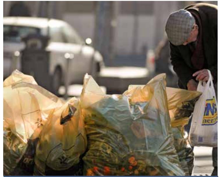
UN POVERO ALLE RICERCA DI PROVVISI

chiedono aiuto soprattutto nelle città più grandi. Si rivolgono alle Caritas soprattutto giovani-adulti, persone che dovrebbero essere nel pieno dell'attività lavorativa (età media 45,8 anni), soprattutto uomini, italiani, con livello di istruzione medio basso, disoccupati (nel 64,3% dei casi), inseriti in un contesto familiare. Tra gli interventi si registrano quelli relativi a beni e servizi materiali, sussidi economici, ma anche quelli finalizzati a costruire progettualità di vita e lavoro, per esempio attraverso il micro-credito e il prestito della speranza. Il Report pone l'attenzione specifica sui giovani, in particolare sul tema delle povertà educative: oltre ai cosiddetti «Neet», coloro che non studiano e non lavorano (840 quelli ascoltati nel 2017, pari all'11,9%), è cresciuta la dispersione scolastica e ci sono situazioni di fragilità economica associate a percorsi di studio frammentati. «Negli ultimi dieci anni - ha sottolineato Callia - è di-