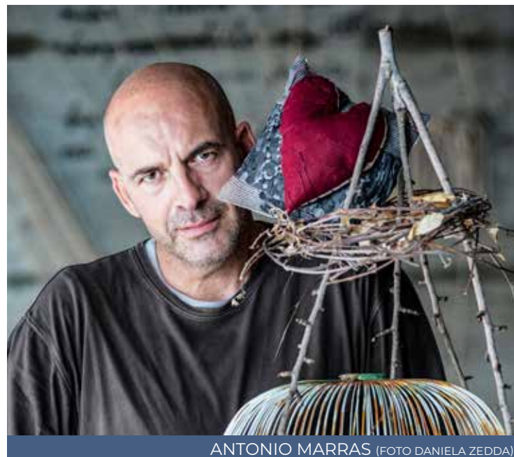
ANTONIO MARRAS

Per esaltare i vari passaggi dello spettacolo, Marras utilizza l'espedito di far introdurre il microfono e la relativa asta da uno dei performer. Un modo per generare movimento in scena, ma, allo stesso tempo, in grado generare attesa nello spettatore intorno alle singole scene che compo-