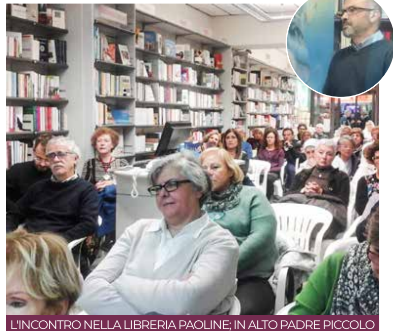
L'INCONTRO NELLA LIBRERIA PAOLINE; IN ALTO PADRE PICCOLO

chiede papa Francesco. Si tratta di adottare una modalità che consente all'universale, la norma o il magistero, di essere declinato nel particolare che è sempre diverso.