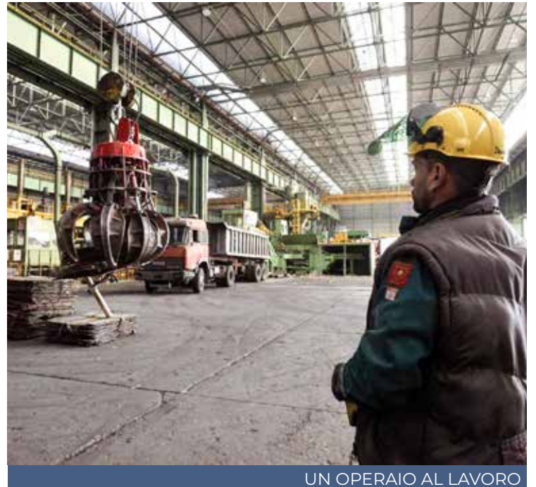
UN OPERAIO AL LAVORO