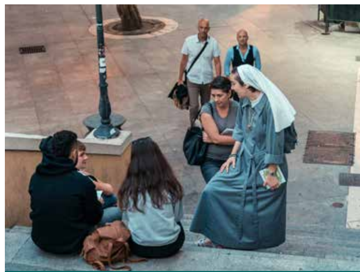
UN MOMENTO DEL WEEKEND DI EVANGELIZZAZIONE

Ciò che accomuna l'approdo dei ragazzi agli incontri con il Signore e intraprendere un cammino di fede rinnovato, unico obiettivo del lavoro di evangelizzazione dei frati di san Mauro, è l'aver accettato l'invito di qualche amico a partecipare