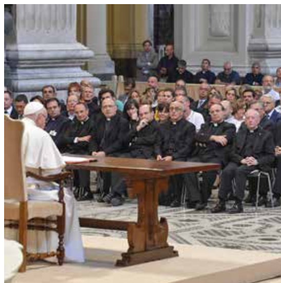
IL PAPA RICEVE I MEMBRI DELLA SACRA ROTA

Per quanto riguarda i coniugi che «sperimentano seri problemi nella loro relazione e si trovano in crisi», il Santo Padre ha fatto presente che «occorre aiutarli a ravvivare la fede e riscoprire la grazia del Sacramento; e, in certi casi - da valutare con rettitudine e libertà interiore - offrire indicazioni appropriate per intraprendere un processo di nullità».