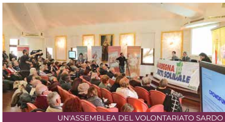
UN'ASSEMBLEA DEL VOLONTARIATO SARDO

I l 16 ottobre alle 16, nell'aula magna della Facoltà teologica, verrà presentato un volume collettivo dedicato al filosofo, teologo e scienziato russo Pavel Florenskij. Si tratta degli atti del convegno tenutosi all'Università di Cagliari nell'ottobre 2017, in occasione degli 80 anni dalla morte dell'autore. Un convegno che ha messo insieme alcuni tra i maggiori studiosi di Florenskij, in campo nazionale e internazionale, e che ha visto una stretta collaborazione tra la Facoltà di Studi Umanistici dell'ateneo cagliaritano (dipartimento di Filosofia) e la Facoltà Teologica della Sardegna. La presentazione dal titolo «Florenskij e la crisi della razionalità: verità e antinomia», vedrà gli interventi di Massimiliano Spano docente della Facoltà Teologica, Lubomir Žak dell'Università Lateranense di Roma e di monsignor Ignazio Sanna, arcivescovo di Oristano. Il testo rappresenta uno degli studi più ampi usciti finora in lingua italiana sull'autore, è curato da Silvano Tagliagambe, Massimiliano Spano e Andrea Oppo e raccoglie i contributi dei 17 relatori del convegno.