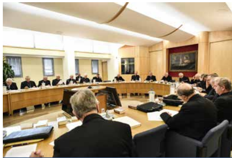
UNA RIUNIONE DEL CONSIGLIO PERMANENTE CEI

Altro tema al centro dei lavori del Consiglio la questione educativa. Un sussidio che aiuti le Diocesi e le comunità parrocchiali a prendere l'iniziativa per un investimento convinto nel mondo della scuola e dell'università; un evento culturale – da celebrarsi nell'autunno del prossimo anno – che riprenda e approfondisca il tema dell'educa-