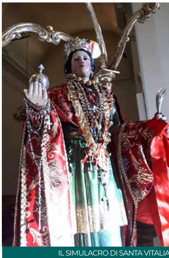
IL SIMULACRO DI SANTA VITALIA