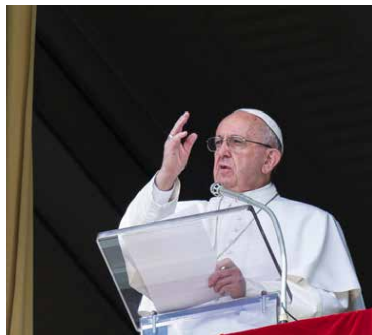
IL PONTEFICE ALL'ANGELUS

Il Papa in Estonia, durante l'incontro ecumenico con i giovani, ha messo in rilievo l'impegno nell'accompagnare le nuove generazioni all'incontro con Cristo: «Tante volte le comunità cristiane si chiudono, senza accorgersene, e non ascoltano le vostre inquietudini. [...] Oggi qui voglio dirvi che vogliamo piangere con voi se state piangendo, accompagnare con i nostri applausi e le nostre risate le vostre gioie, aiutarvi a vivere la sequela del Signore. Voi, ragazzi e ragazze, giovani, sappiate questo: quando una comunità cristiana è veramente cristiana non fa proselitismo. Soltanto ascolta, accoglie, accompagna e cammina; ma non impone niente. [...] Ragazzi e ragazze, l'amore non è morto, ci