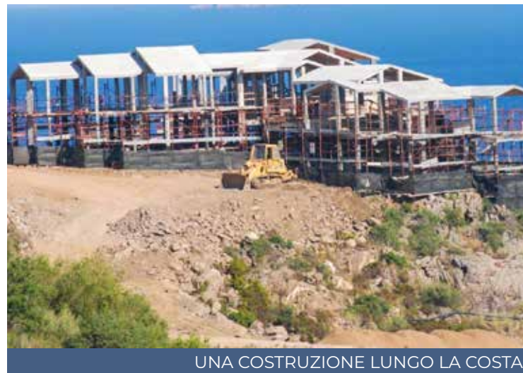
UNA COSTRUZIONE LUNGO LA COSTA

pio e compatto su una buona proposta di legge e preferiamo ammettere con onestà che c'è una difficoltà». Qualche segnale di scollamento in effetti si era già presentato il 31 agosto scorso quando il Consiglio delle Autonomie locali aveva fatto mancare il proprio parere già in Commissione per la necessità di avere altro tempo per esprimere un giudizio. «Questo testo - si legge in una nota del Cal - cala dall'alto un impianto normativo di difficile attuazione, inoltre ancora una volta vi è la tendenza privare i comuni di competenze e risorse a vantaggio dell'apparato regionale, quello stesso che deve necessariamente essere dimagrito. Non ci sono risorse per i comuni per applicare la legge. Gli enti locali vengono allontanati, se non esclusi dai processi decisionali». E proprio nel documento prodotto dall'assessore Erriu si fa cenno al Consiglio delle autonomie «Durante il percorso - conclude la nota del Cal - c'è stato un vulnus insuperabile che riguarda la mancata acquisizione del parere del Cal». Di per sé il ritorno in commissione potrebbe essere una pratica auspicabile per far in modo di recepire le obiezioni della discussione, per dar vita a un documento condiviso e che non abbia bisogno di colpi di maggioranza, ma in questo frangente sono venute a mancare la discussione, la condivisione ma soprattutto la