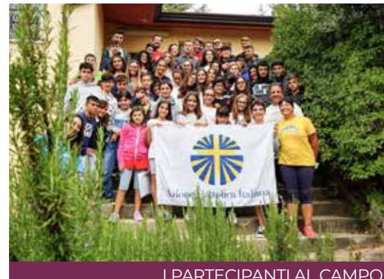
I PARTECIPANTI AL CAMPO

Il tema sviluppato durante le giornate aveva come protagonista Giuseppe, figlio di Giacobbe: attraverso giochi e attività, i ragazzi si sono confrontati con la sua storia e hanno potuto riflettere sui loro sogni, sulle difficoltà e sulle scelte che la vita pone loro davanti. Guidati dagli educatori, si sono anche messi in gioco e hanno dimostrato di saper cogliere e apprezzare il senso delle attività proposte: sognare in grande e sapere di non essere mai soli! Ma un campo-scuola non è solo attività e giochi: le relazioni tra i partecipanti hanno creato un clima di gioia