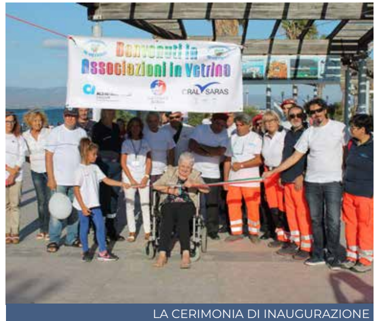
LA CERIMONIA DI INAUGURAZIONE

zu, promotrice della iniziativa e volontaria dell'associazione “Alzheimer Cagliari” – dedicata alla figura del volontario, inteso come mezzo attraverso cui arriva l'aiuto, l'informazione, l'ascolto, il supporto. A tutti coloro che ci chiederanno chi sia il volontario risponderemo con un'unica voce, senza evidenziare nessuna appartenenza, ma solo considerando il mondo eterogeneo che lo contraddistingue. Parliamo perciò di fedelissimi dell'assistenza, educatori/educatrici, di pionieri laici ed istruiti, di investitori di cultura, di volontari dello sport, di donatori di sangue, di coloro che mettono a disposizione se stessi, di chi porta il sorriso, di coloro che insegnano a rispettare l'ambiente. Poi ci sono quelli che, al di là di tutto, ci saranno sempre. Ci sono poi le persone che aiutano a capire quelli che sono i diritti e i doveri di ogni cittadino, ci sono i nostri fedeli volontari a quattro zampe». Per la quarta edizione di «Associazioni in vetrina» domenica sono previsti importanti novità