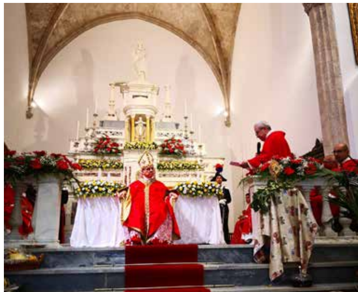
IL SALUTO DI DON PALA AL CARDINALE BECCIU

Al suo arrivo ma soprattutto dopo la Messa tantissimi coloro