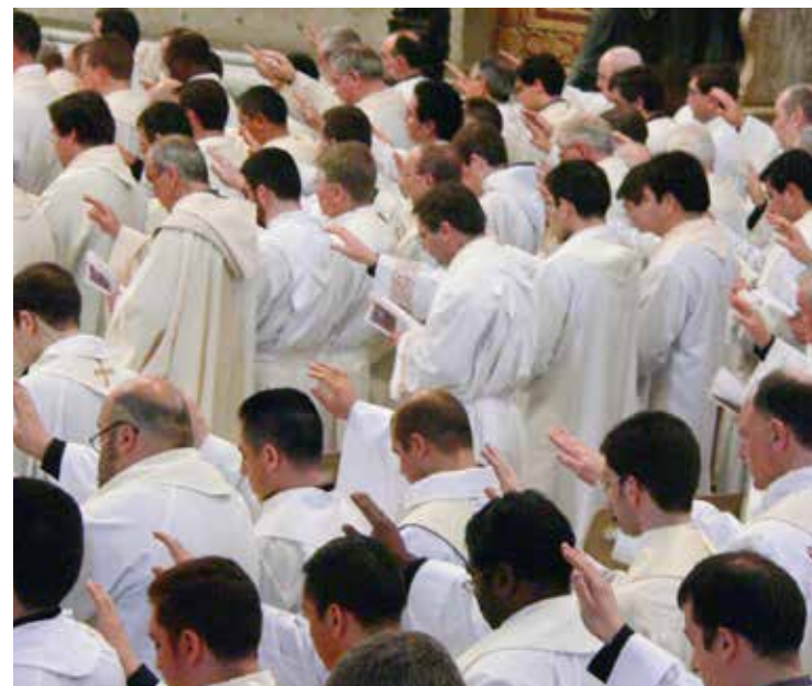
SACERDOTI NEL CORSO DI UNA CELEBRAZIONE