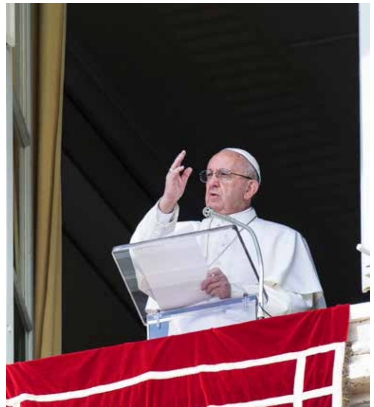
IL PONTEFICE ALL'ANGELUS

«A più riprese – ha fatto presente il Papa – ho chiesto perdono al Signore per questi peccati, per lo scandalo e il senso di tradimento procurati. I Vescovi irlandesi hanno intrapreso un serio percorso di purificazione e riconciliazione con coloro che hanno sofferto abusi, e con l'aiuto delle autorità nazionali hanno stabili-