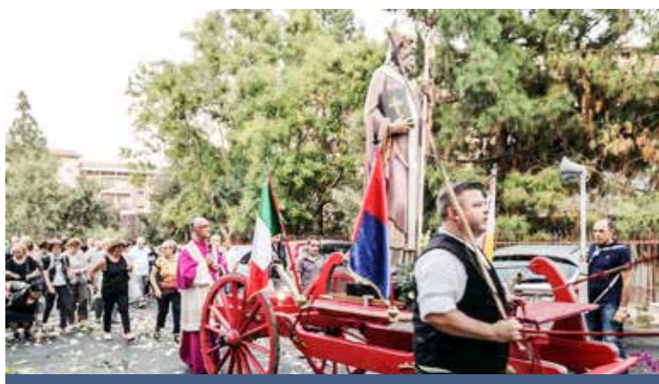
LA PROCESSIONE DI SANTEUSEBIO