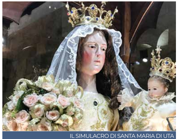
IL SIMULACRO DI SANTA MARIA DI UTA