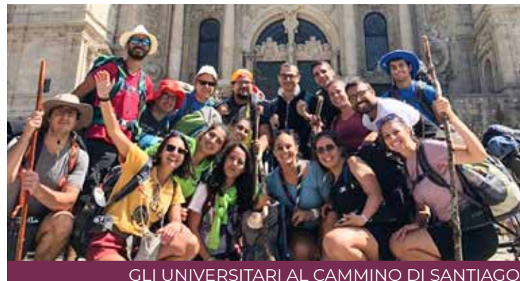
GLI UNIVERSITARI AL CAMMINO DI SANTIAGO

Ufficio diocesano di Pastorale Universitaria