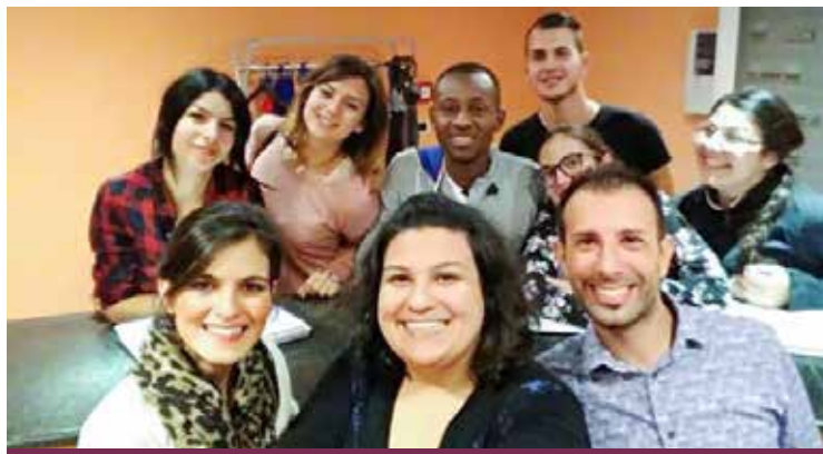
VOLONTARI DEL SERVIZIO CIVILE

Dopo l'Open day di mercoledì la Caritas è pronta ad accogliere le richieste per i progetti del Servizio Civile.