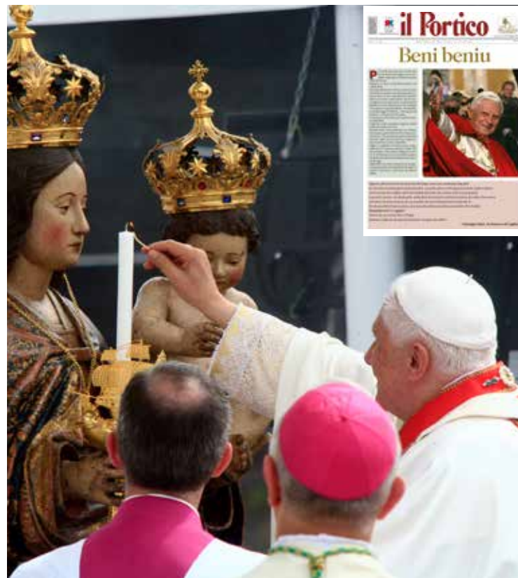
BENEDETTO XVI A BONARIA; IN ALTO IL SALUTO DE IL PORTICO

La folla composta e ordinata che dal sagrato di Bonaria si estendeva fino al mare, la scalinata con-