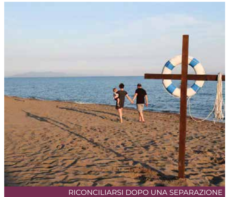
RICONCILIARSI DOPO UNA SEPARAZIONE

«Retrouvaille», come si vede nel nostro logo, è un salvagente per matrimoni in difficoltà. Non è obbligatorio essere credenti per partecipare al programma. Si tratta di un servizio esperienziale offerto a coppie sposate senza differenza di credo o affiliazione religiosa, sposate civilmente o conviventi stabili, coppie separate o divorziate, che intendono seria-