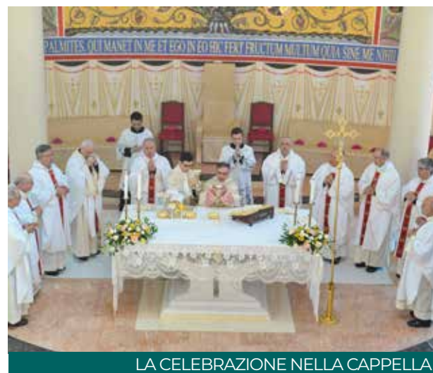
LA CELEBRAZIONE NELLA CAPPELLA