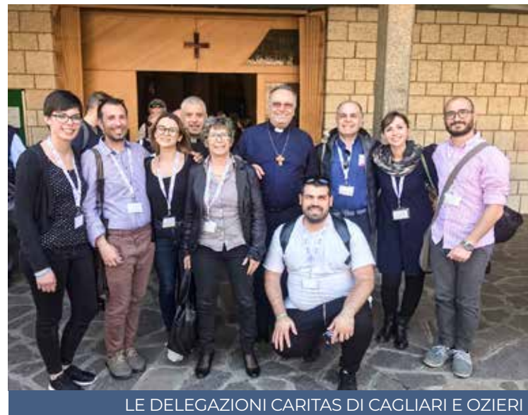
LE DELEGAZIONI CARITAS DI CAGLIARI E OZIERI

entro dal Convegno - nello spirito pastorale Caritas su come far crescere comunità, alla luce della testimonianza della carità in una società sempre più fatta da anziani. Partire dai giovani, dalle loro fatiche e necessità, è la sfida che ci portiamo a casa, in una dimensione locale che diventa anche globale, con uno sguardo alla mediterraneità: non si può immaginare sviluppo, se non attraverso progettualità che uniscano i giovani italiani e i giovani immigrati, in un percorso di crescita e realizzazione personale». È interessante vedere, ha continuato il direttore, «come anche in altre parti d'Italia, non solo in Sardegna, pensando ai giovani si pensi alle potenzialità di sviluppo legate alla terra, all'agricoltura, alla