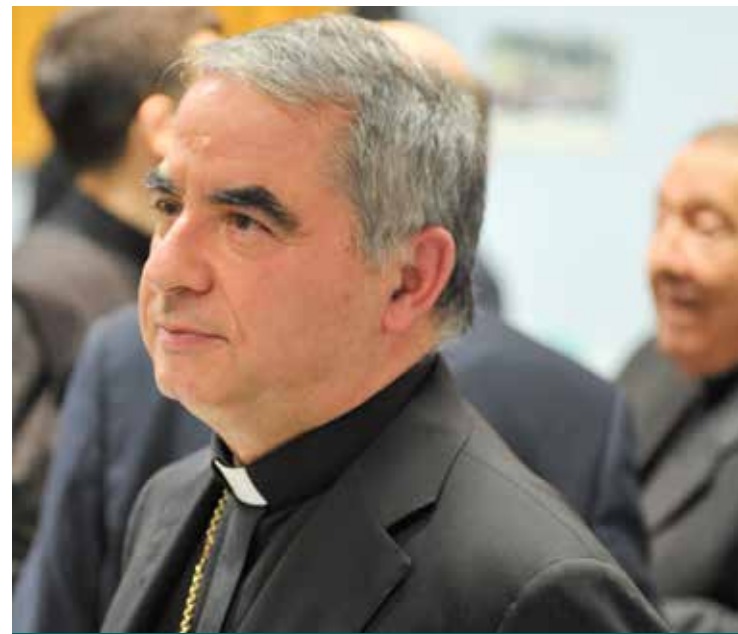
MONSIGNOR ANGELO BECCIU

Sono preoccupato perché troppi giovani sono senza lavoro e sono costretti a partire. Qualcuno viene da me ma non posso fare nulla per loro e mi piange il cuore. In Sardegna si dovrebbe essere più creativi senza aspettare che altri risolvano i problemi. Chi ha la responsabilità della cosa pubblica deve sentire il dovere di impegnarsi per risolvere questo, come altri problemi.