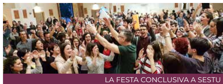
LA FESTA CONCLUSIVA A SESTU