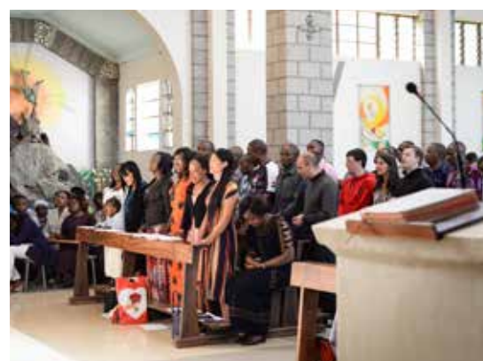
LA MISSIONE DI NANYUKI