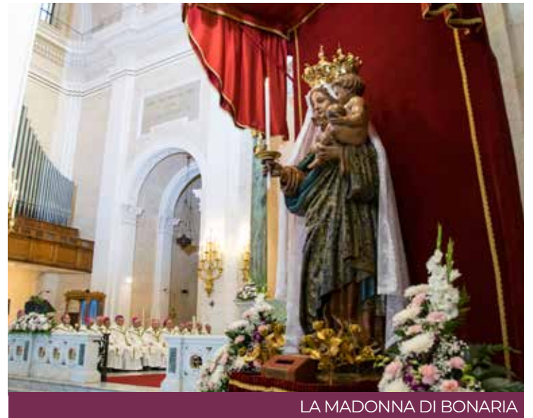
LA MADONNA DI BONARIA

Tutte le feste le abbiamo celebrate alla luce di questo giubileo mercedario. In particolare abbiamo vissuto la festa della Madonna di Bonaria nella gioia, nell'opportunità di incontrare Maria, madre della Mercede e dell'amore. Ma soprattutto madre di Gesù Redentore, al quale noi ci ispiriamo, dato che nasciamo come ordine che si prefiggeva la liberazione di coloro che erano caduti in schiavitù o come prigionieri. Tutt'ora, in numerosi campi di apostolato, laddove è possibile redimere materialmente, perseguiamo questo intento. Cerchiamo ovunque sia possibile di ridare una dignità umana alle persone che vivono momenti di difficoltà