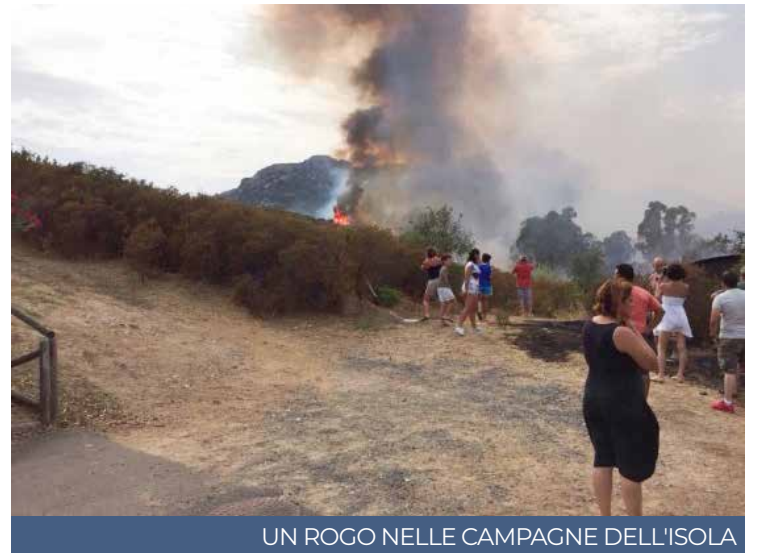
UN ROGO NELLE CAMPAGNE DELL'ISOLA

Le Organizzazioni professionali agricole si impegnano ad organizzare, d'intesa con il Corpo fo-