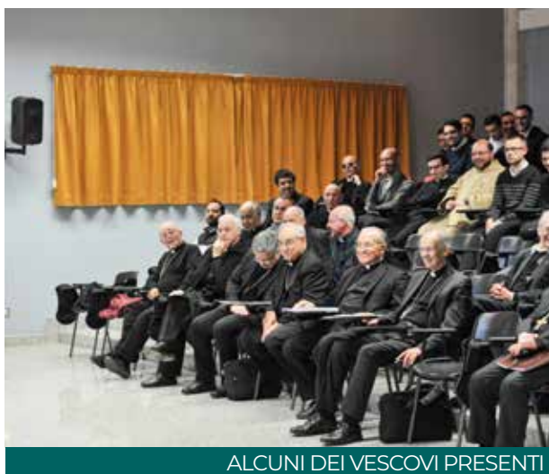
ALCUNI DEI VESCOVI PRESENTI