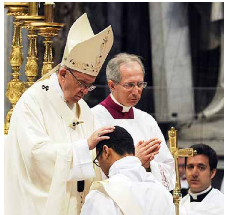
IL PAPA PRESIEDE LA MESSA DI ORDINAZIONE SACERDOTALE

In settimana, all'Udienza generale, il Papa ha proposto una catechesi sul battesimo come segno della fede cristiana, soffermandosi in particolare sull'aspetto della testimonianza personale: «Il battesimo accende la vocazione personale a vivere da cristiani, che si svilupperà in tutta la vita. E implica una risposta personale e non presa a prestito, con un "copia e incolla". La vita cristiana infatti è intessuta di una serie di chiamate e di risposte: Dio continua a pronunciare il nostro