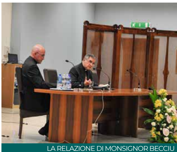
LA RELAZIONE DI MONSIGNOR BECCIU

Istantanee della seconda Giornata degli ex-allievi