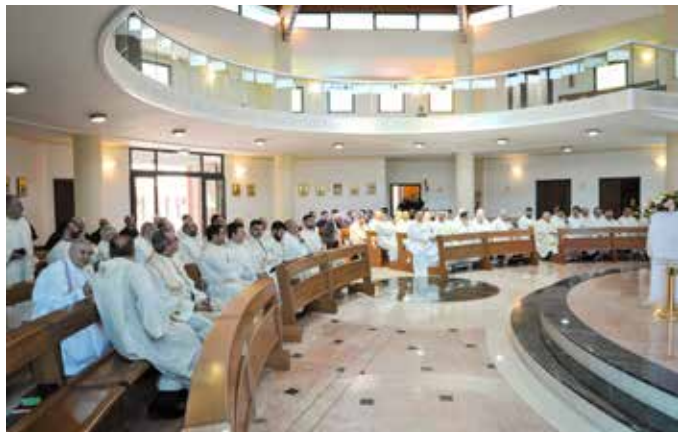
SACERDOTI ALLA CELEBRAZIONE IN CAPPELLA

Istantanee della seconda Giornata degli ex-allievi