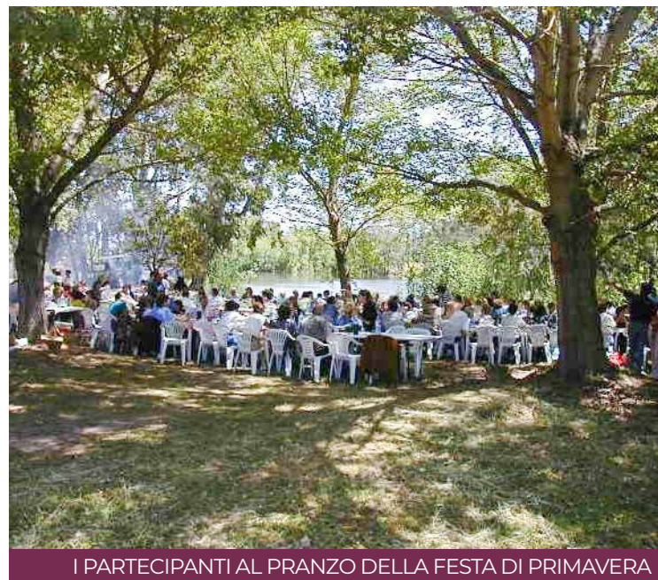
I PARTECIPANTI AL PRANZO DELLA FESTA DI PRIMAVERA

Dopo una breve tappa al punto ristoro si continua verso il «Parco 22 Ottobre», passando per la vecchia strada ferrata che collegava